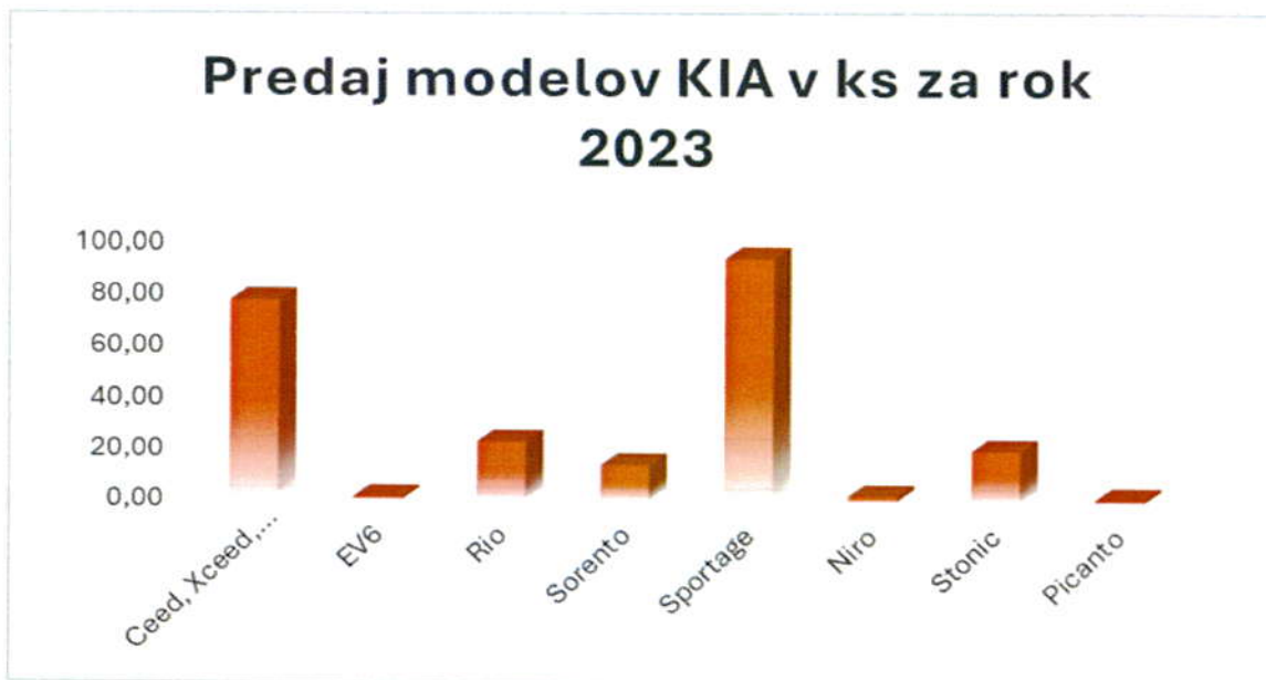
Graf 2: Porovnanie predajov jednotlivých modelov značky KIA

Spoločnosť analyzovala rizikové faktory. V oblasti technológií je problém hlavne so zabezpečením kvalifikovaných pracovníkov hlavne na pozície servisu motorových vozidiel, špeciálne pozíciu autolakýrnik. Spoločnosť sa to snaží riešiť aj primeraným finančným zabezpečením zamestnancov, aby nedošlo k úbytku vyškolených zdrojov. Tento problém by bolo možné riešiť aj vďaka zmenám v duálnom systéme vzdelávania a tak si pomôcť vychovať pracovníkov na jednotlivé pozície ale efekt by sa prejavil až v dlhšom časovom horizonte.