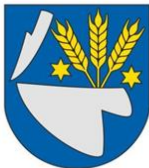
Obrázok 1 Erb mesta Trebišov

Aby sa zabránilo nedôstojnému zneužívaniu erbu mesta inými neoprávnenými subjektmi, mestské zastupiteľstvo uznesením vo februári roku 2004 schválilo Všeobecne záväzné nariadenie o zásadách používania erbu a vlajky Trebišova. Nariadenie podrobne ustanovuje kto a ako môže používať erb mesta, stanovuje poplatky a sankcie. Každý kto chce erb Trebišova použiť alebo používať je povinný požiadať písomne primátora mesta o vydanie súhlasu. Žiadosť musí obsahovať grafický návrh, z ktorého bude zrejmý účel a spôsob jeho použitia.