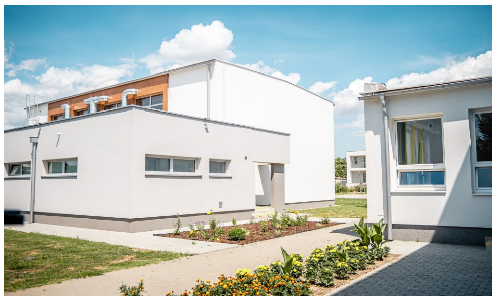
Prístavba telocvične pri Základnej škole