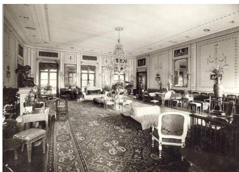
Dobové fotografie interiéru