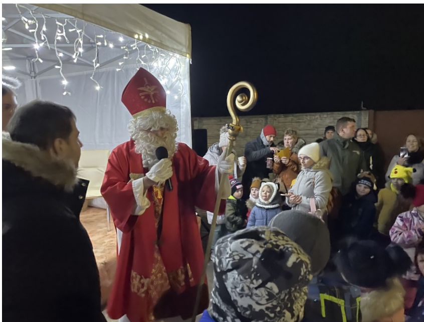
Keď príde Mikuláš