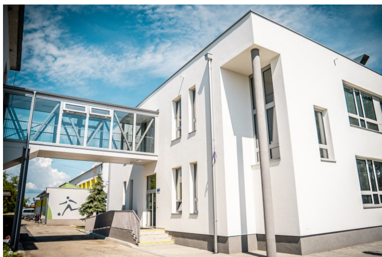
Prístavba základnej školy