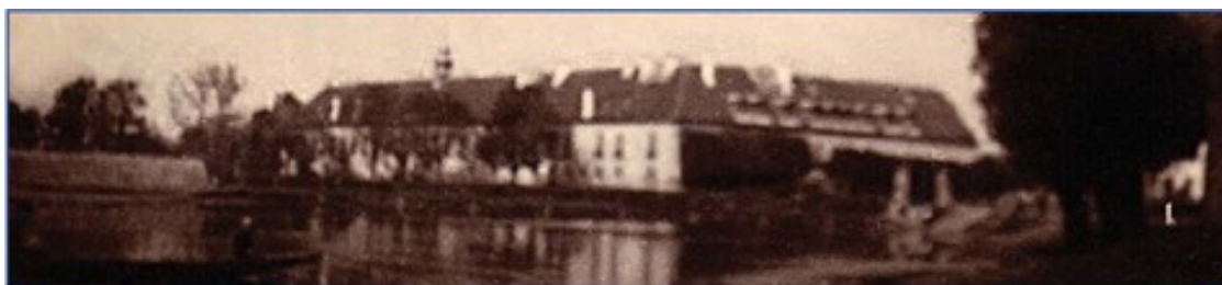
Pôvodný kaštieľ rodu Pálffyovcov (fotografia z roku 1935)

metačnej listiny o vymedzení chotárnych hraníc sa v obci Kráľová nachádzal poľovnícky zámok kráľa Žigmunda Luxemburského, kam rád chodieval na poľovačky aj kráľ Matej Korvín. V 17. storočí sa obce Krmeš a Kráľová stali postupne majetkom šľachtického rodu Pálffyovcov, ktorí tu v priebehu dvoch storočí vybudovali vzorový hospodársko - poľnohospodársky podnik. V rokoch 1712 - 1715 dali v barokovom štýle prestavať tunajší kaštieľ a jeho krásu zvýraznili rozsiahlou francúzskou záhradou a anglickým parkom, ktoré spájal doteraz stojaci záhradný barokový most na okraji obce. Po smrti posledného majiteľa kráľovského panstva a tunajšieho kaštieľa Jána Pálffyho v roku 1908, majetok kráľovského panstva postupne devastoval až nakoniec bol v rokoch 1940 - 1945 úplne zničený.