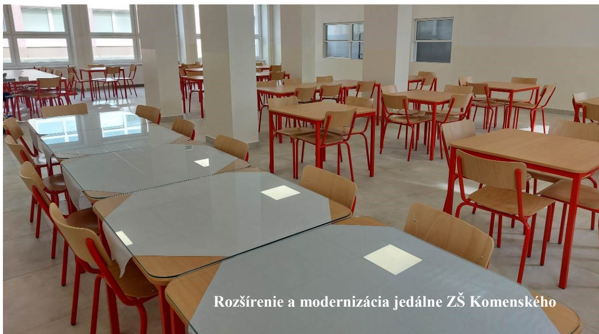
Rozšírenie a modernizácia jedálne ZŠ Komenského