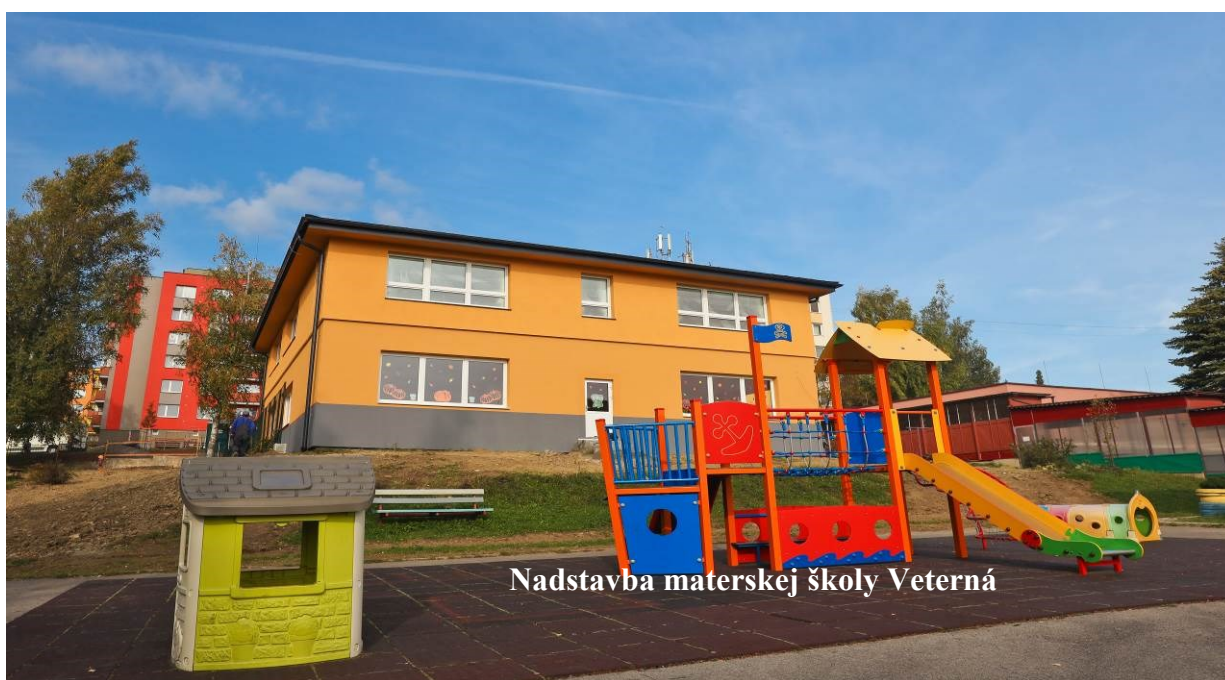
Nadstavba materskej školy Veterná