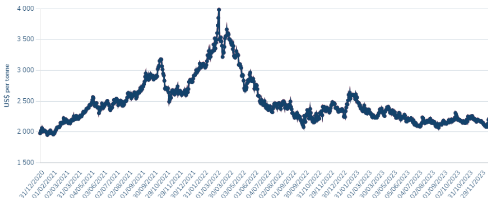
Vývoj cien hliníka na Londýnskej burze (LME) USD/t