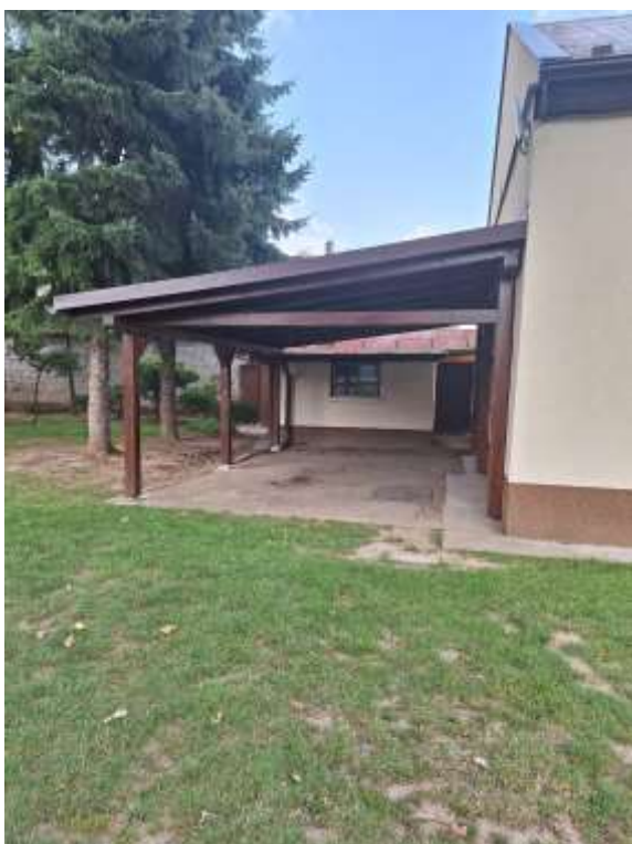
Altánok pri Ocu