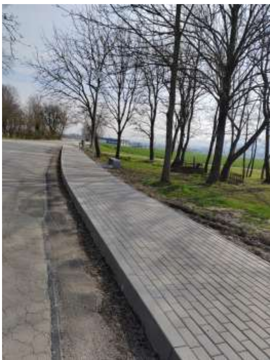
Chodník do Melčíc