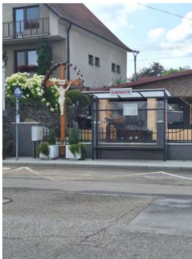
Autobusová zastávka