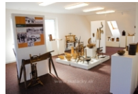
Múzeum Michala Tillnera