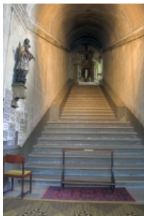
Kaplnka Svätých schodov