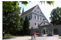
Františkánsky kláštor a kostol