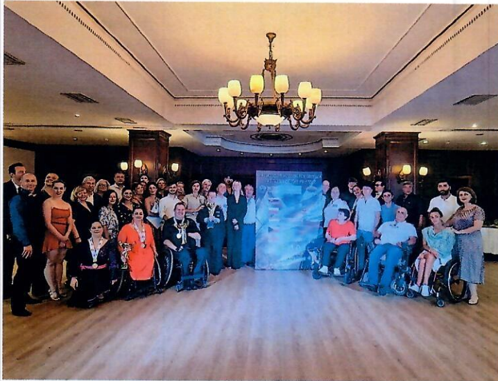
Naša misia v Gruzínsku