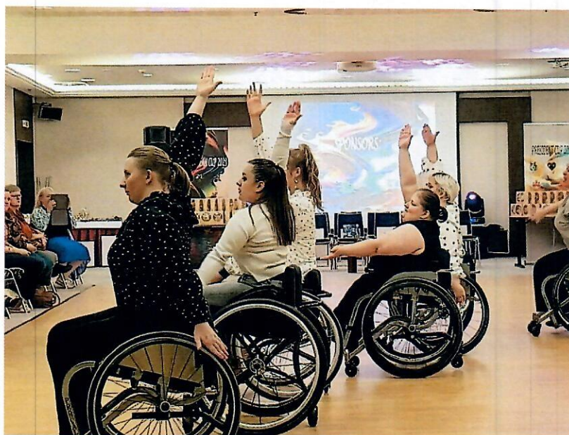
Tanečné podujatia a súťaže