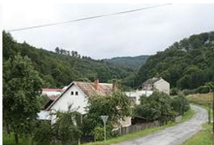
Údolie Prikrianky s chránennou krajinou oblasťou Východné Karpaty