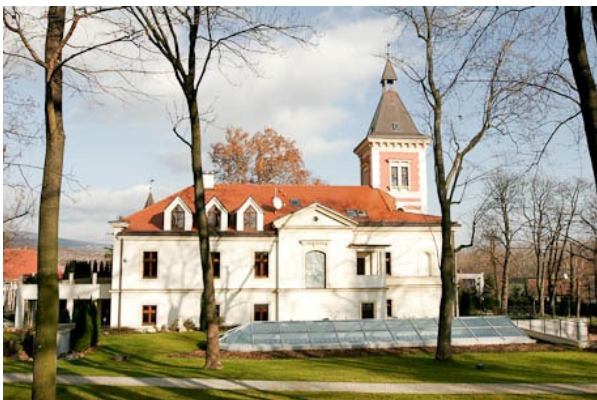
Pálffyho kaštieľ - Barokový kaštieľ z roku 1776, v roku 1884 bol prebudovaný.

Kráľovský Les - Existenciu Kráľovského lesa (Königswald, Baumwald, Baurvaldov háj, Pan-Vald, Panholský háj, Bahnwald) dokumentuje presnejšie doklad z roku 1615, keď kráľ Matej II. potvrdil a vydal listinu palatína Juraja Thurzu, v ktorej sa určili chotárne hranice mestečka Pezinka a pezinského hradu, kde je spomínaný „ istý náš hájený les (od quandamsyluamnostramprohibiticiam), ktorý oddeľuje klčoviská na území pezinských mešťanov “.