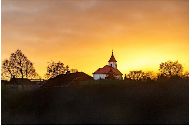
Kostol sv. Martina - Rímskokatolícky kostol svätého Martina z 19. storočia