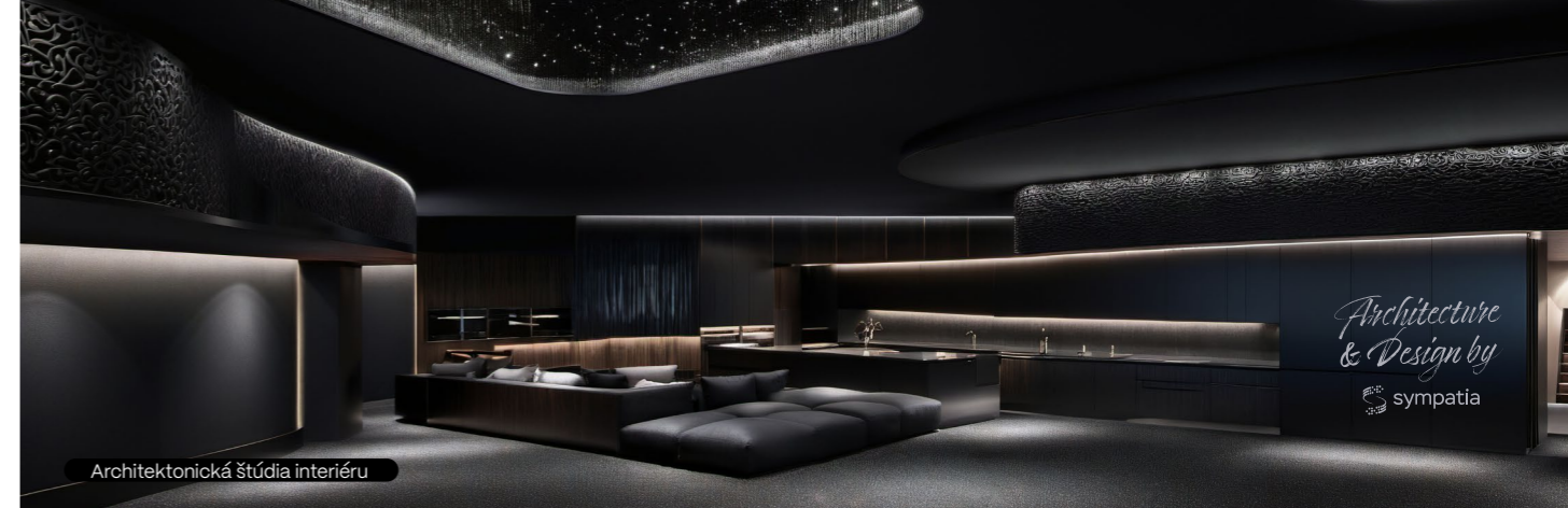
Architektonická štúdia interiéru