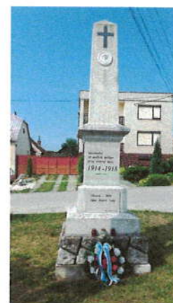
Pomník padlým v I. svetovej vojne