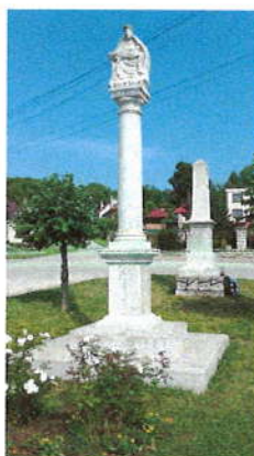
Pomník Sedembolestnej Panny Márie Šaštínskej