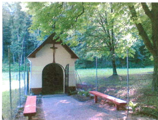
Kaplnka Najsvätejšej Trojice pod Mariášom