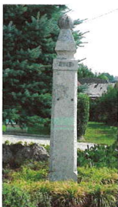
Pranier – stĺp hanby