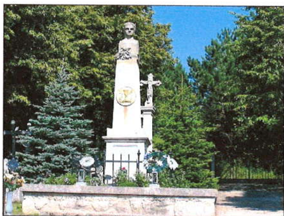
Pomník Jána Hollého