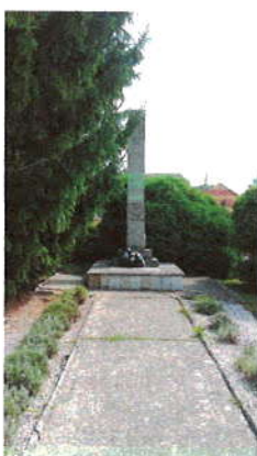
Pomník padlým v II. svetovej vojne