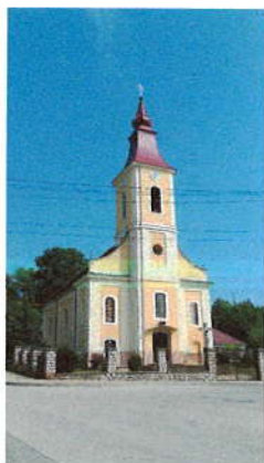
Kostol narodenia Panny Márie

pomník bol postavený z verejnej zbierky a bol odhalený 11. mája 1854 na piate výročie smrti básnika, o diele a živote básnika Jána Hollého sa môžu návštevníci obce viac dozvedieť v Pamätnej izbe Jána Hollého, ktorá bola otvorená v roku 1985 a v súčasnosti ju prevádzkuje obecný úrad, - pomník pačlým v prvej svetovej vojne (1914 – 1918), ktorý postavili dobrovodskí kamenári, - pomník pačlým v druhej svetovej vojne (1939 – 1945).