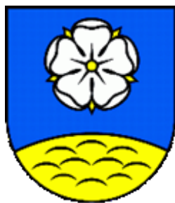
Erb obce Pusté Pole

Obecná vlajka má podobu piatich pozdĺžnych pruhov žltého, bieleho, žltého, modrého a žltého. Vlajka má pomer strán 2:3 a ukončená je tromi cípmi, t.j. dvomi zastrihni siahajúcimi do tretiny jej listu. Farebnosť pruhov na vlajke je daná farbami obecného erbu.