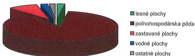
Graf č. 10 - Využitie pôdneho fondu obce Hul