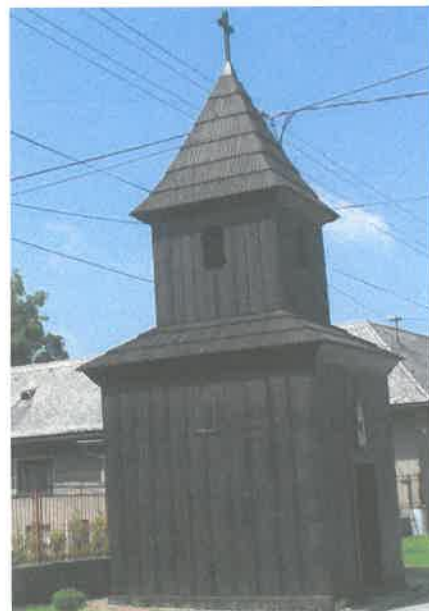
Obrázok č. 3: Drevená zvonica z prvej polovice 19. storočia

Drevená zvonica so štvorcovým pôdorysom a v stavanou vežou, šalovaná, debnená, s nadstavcom, vysadenou izbicou a ihlanovou strechou bola postavená v polovici 19. storočia. Vo výklenku bola v minulosti ľudová socha, kópia Piety z Tužiny z 1. polovice 19. storočia. Vo veži je zvon z roku 1783, ktorý je od roku 2010 v zozname národných kultúrnych pamiatok. V obci je niekoľko kamenných sypární a drevených krížov z 20. storočia.