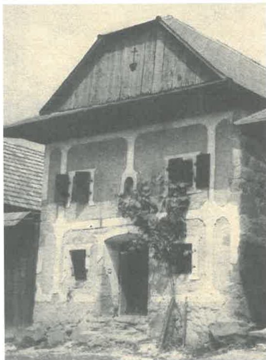
Obrázok č. 4: Kamenná sypáreň (pri dome č. 78)