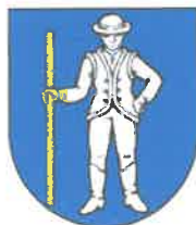
Obrázok č. 1: Erb obce Lipník

Súčasný erb obce vychádza z historickej pečate Lipníka a zobrazuje v modrom štíte stojaceho striebroodetého muža v klobúku, v čižmách, s ľavou rukou vbok a v pravici drží dlhú zlatú palicu (pravdepodobne predstavuje gazdu alebo richtára).