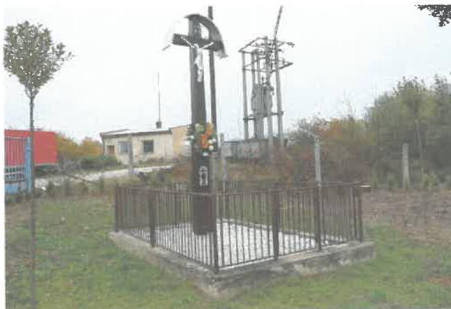
Obrázok č. 5: Obnovený drevený kríž (pri býv. družstve)