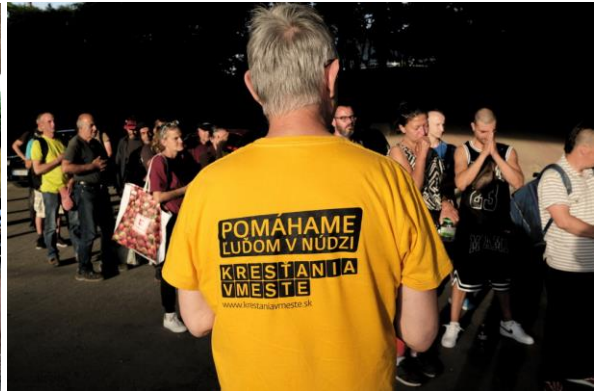
Výdaje teplého jedla pod mostom Lafranconi