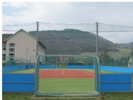
Multifunkčné ihrisko v Bošáci