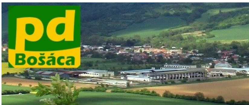
Areál Poľnohospodárskeho družstva Bošáca

Potravinársky priemysel je zastúpená firmou: