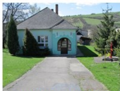
Materská škola