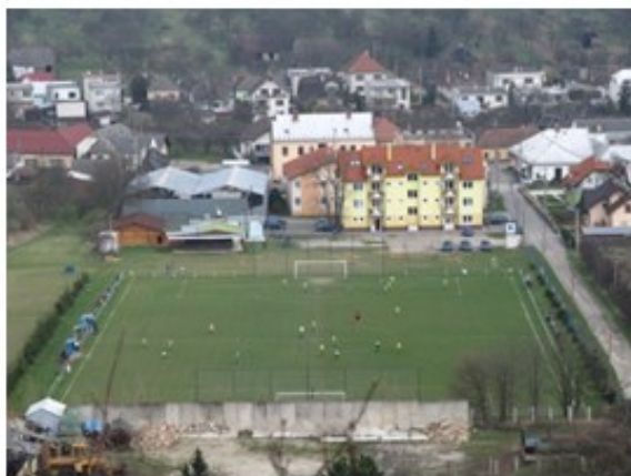
Futbalové ihrisko v Bošáci

osemdesiatich rokov 20. storočia rozšírené o tenisový kurt, ktorý je už zničený a jeho plocha sa tiež v zimných mesiacoch využívala ako klzisko. V roku 2019 bol v areáli Sokolovne vybudovaný amfiteáter, ktorý sa v súčasnej dobe využíva na kultúrne predstavenia.