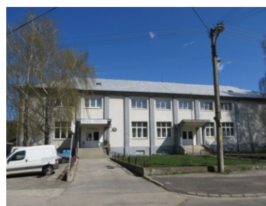
Kultúrny dom

V obci pôsobí niekoľko organizácií, ktoré svojou činnosťou zveľaďujú kultúrno-spoločenské dianie v obci.