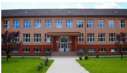
Základná škola

Základná škola s materskou školou Ľ.V.Riznera v Bošáci, Základná umelecká škola Bošáca a Spojená škola Bošáca 396 hospodária s vlastnými finančnými prostriedkami a je napojená na rozpočet obce.