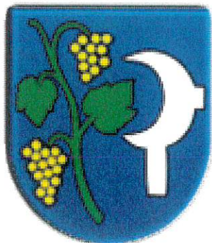
Erb obce :