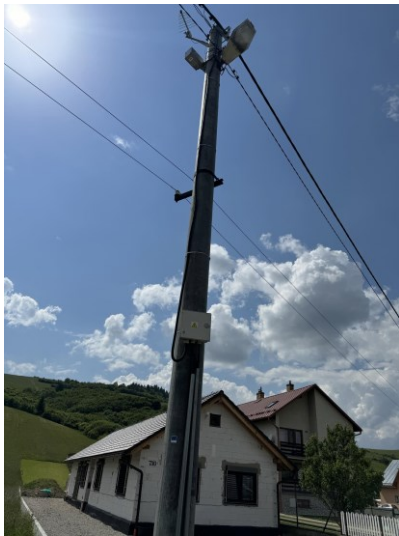
Varovný a vyzumievací systém