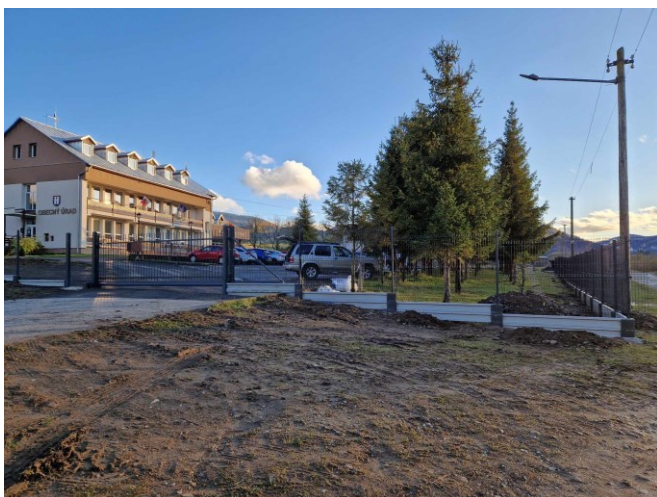
Oplotenie s bránou