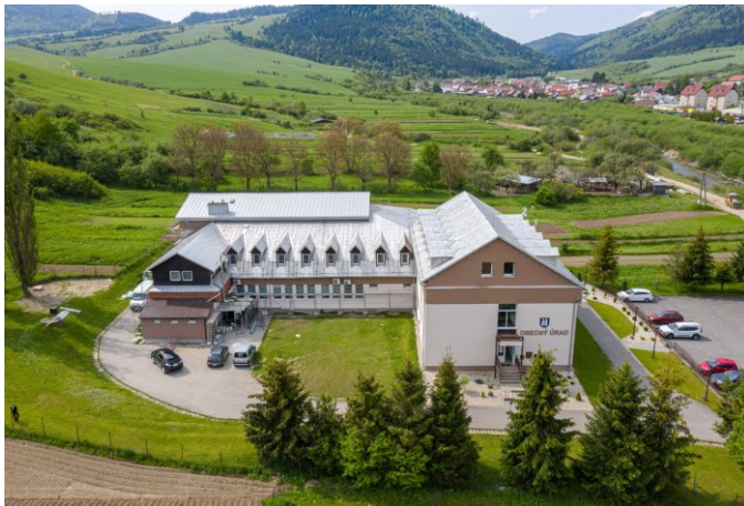
Zatepl'ovanie kultúrneho domu