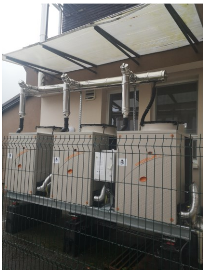
Tepelné čerpadlá pri obecnom úrade