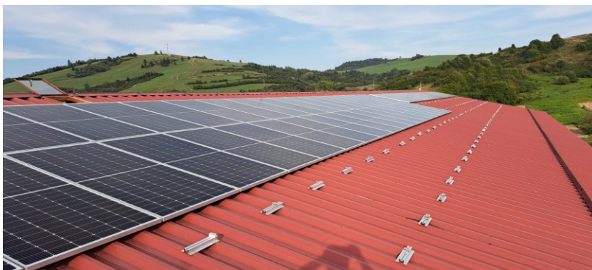
Fotovoltaické zariadenie pre ZŠ s MŠ