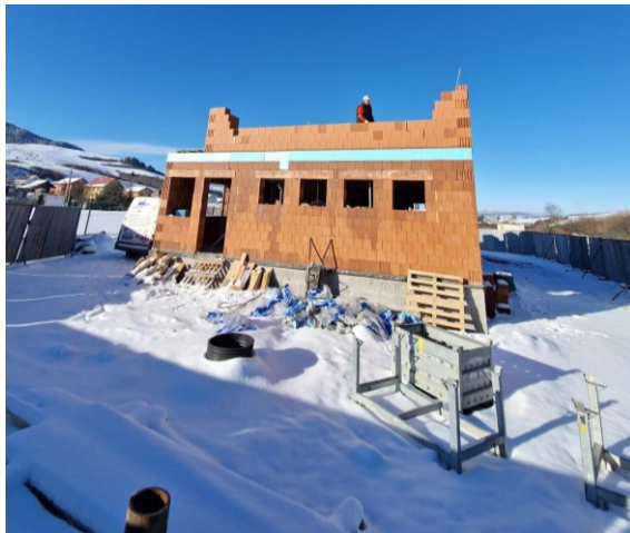
Výstavba nových šatní