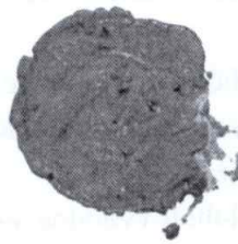
Odtlačok typária z r. 1859