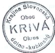
Odtlačok pečate obce z r. 1935