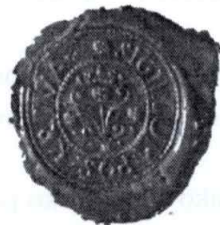
Odtlačok obecného pečatidla z r. 1842