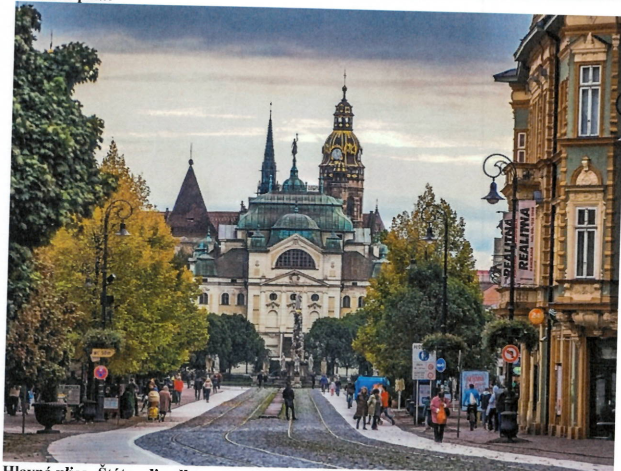
Hlavná ulica- Štátne divadlo