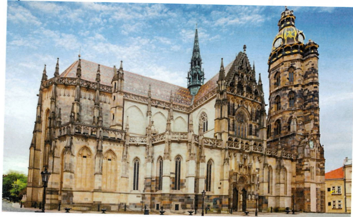
Dóm sv. Alžbety