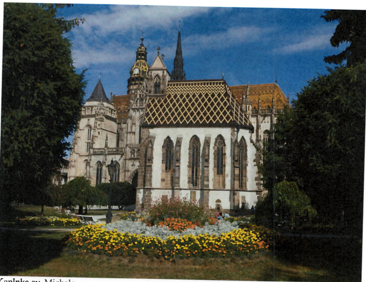
Kaplnka sv. Michala