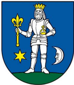
Erb obce :