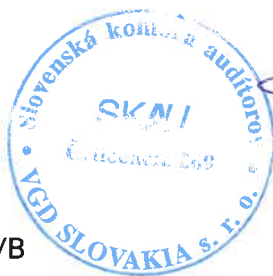
Zodpovedný audítor Bart Waterloos Licencia UDVA č. 1029

VGD SLOVAKIA s. r. o. Karpatská 8 811 05 Bratislava Obchodný register, zložka 74698/B Licencia SKAU č. 269