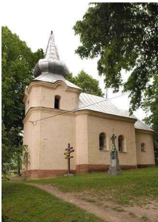
PETKOVCE - Sv. Kozma a Damián, 1700 (NKP)

Gréckokatolícky kostol sv. Kozmu a Damiána, jednolod'ová baroková stavba s polkruhovým ukončením presbytéria a predstavanou vežou, z obdobia okolo roku 1700. Úpravami prešiel v roku 1927 a 1971. Interiér je zaklenutý hrebienkovými križovými klenbami, v presbytériu valenou klenbou s lunetami.