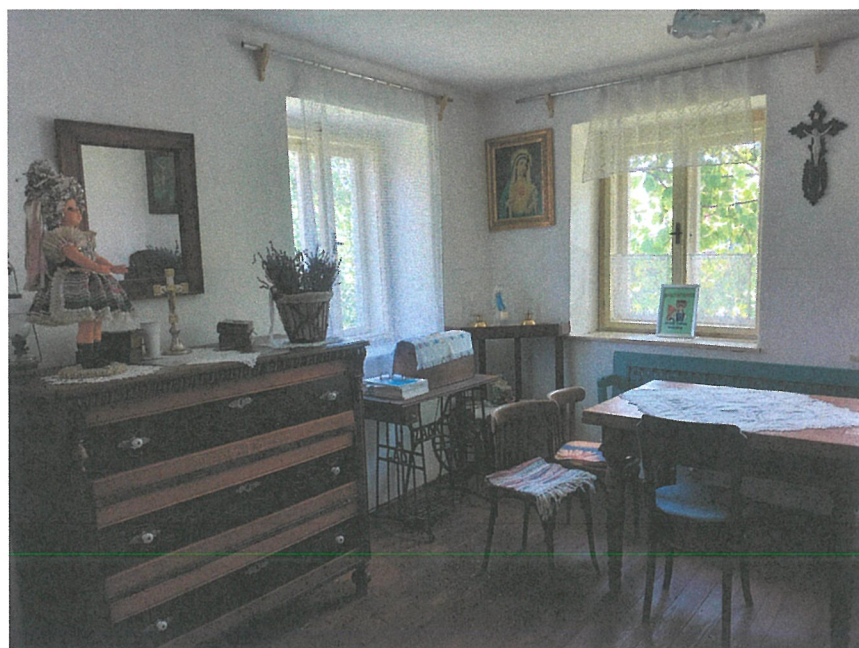
Ľudový dom v Starom Tekove