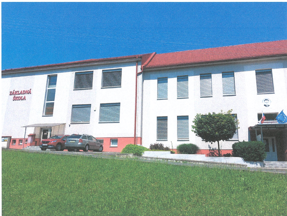
Budova Základnej školy Štefana Senčíka Starý Tekov

Na základe analýzy doterajšieho vývoja možno očakávať, že rozvoj vzdelávania sa bude orientovať na základné vzdelávanie a predškolskú výchovu.