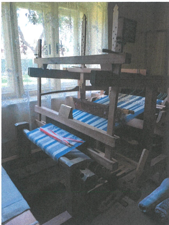
Tkáčsky stav v Ľudovom dome