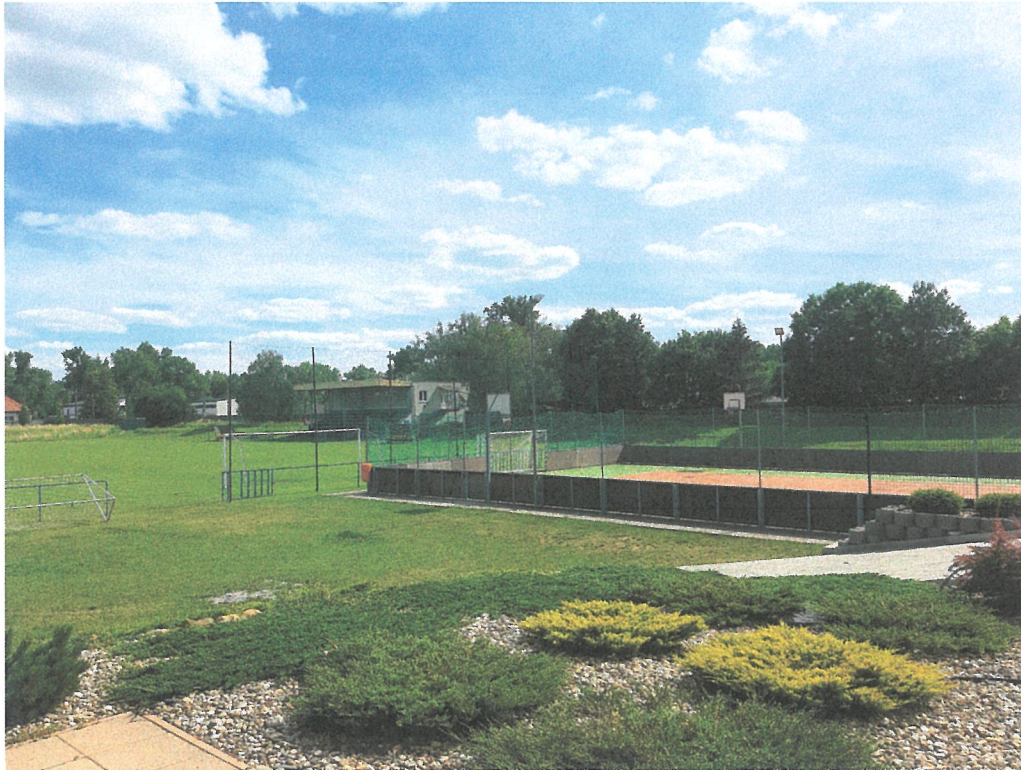
Športový areál – futbalové ihrisko, vpravo multifunkčné ihrisko