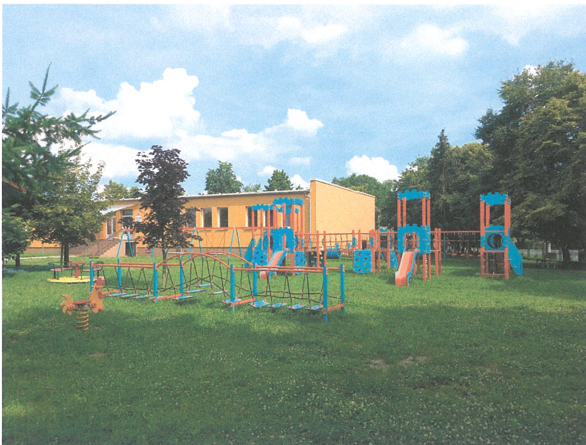
Budova Materskej školy Starý Tekov