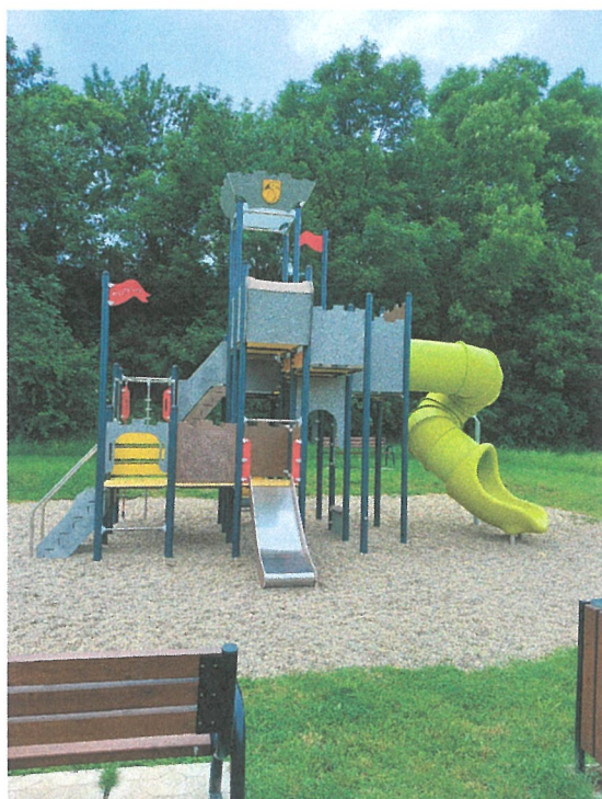
Detské ihrisko- Hrad s tobogánom pri Mlyne