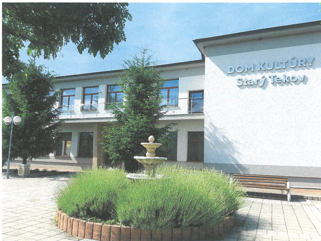
Budova Domu kultúry Starý Tekov