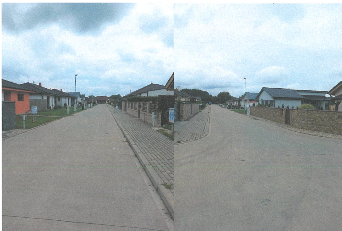
Prebiehajúca individuálna bytová výstavba na vytvorenej IBV – Vranie diely (podľa schválených zmien a doplnkov č.1 k ÚPN obce Starý Tekov)

V roku 2022 bol vypracovaný návrh Zmien a doplnkov č.2 k ÚPN Obce Starý Tekov k doplneniu plošnej rezervy bývania formou IBV.