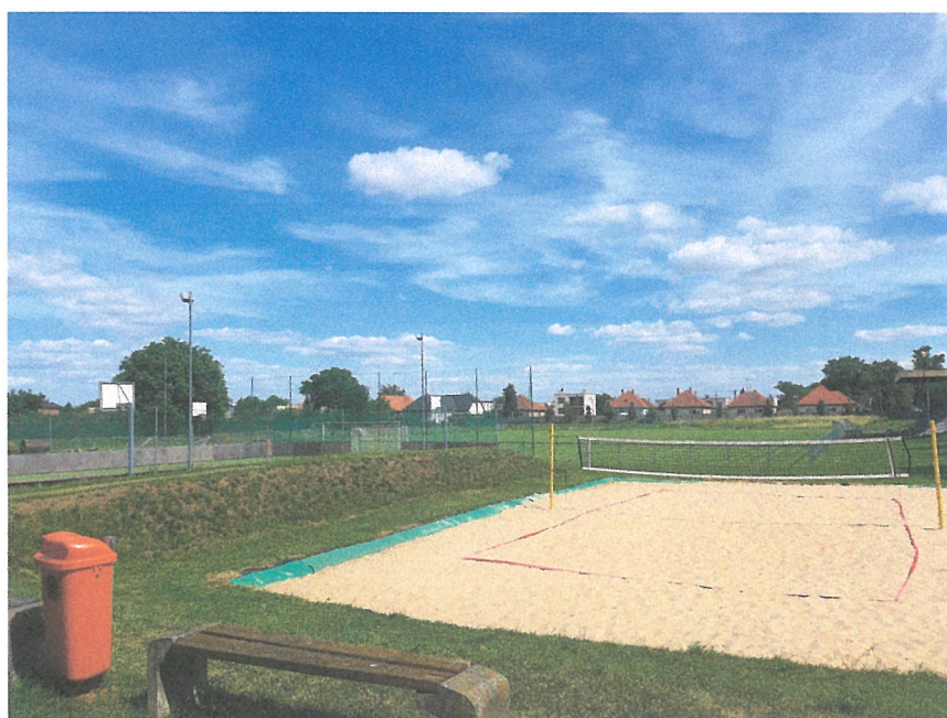
Športový areál – beachvolejbalové ihrisko