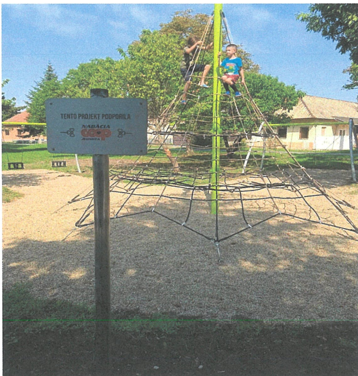
Detské ihrisko na námestí v parku 9.mája