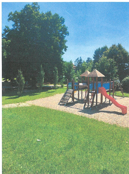
Detské ihrisko s preliezkami pri ZŠ