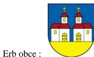
Erb obce :