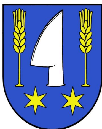
ĚRB MESTSKEJ ČASTI VEĽKÉ BEDZANY