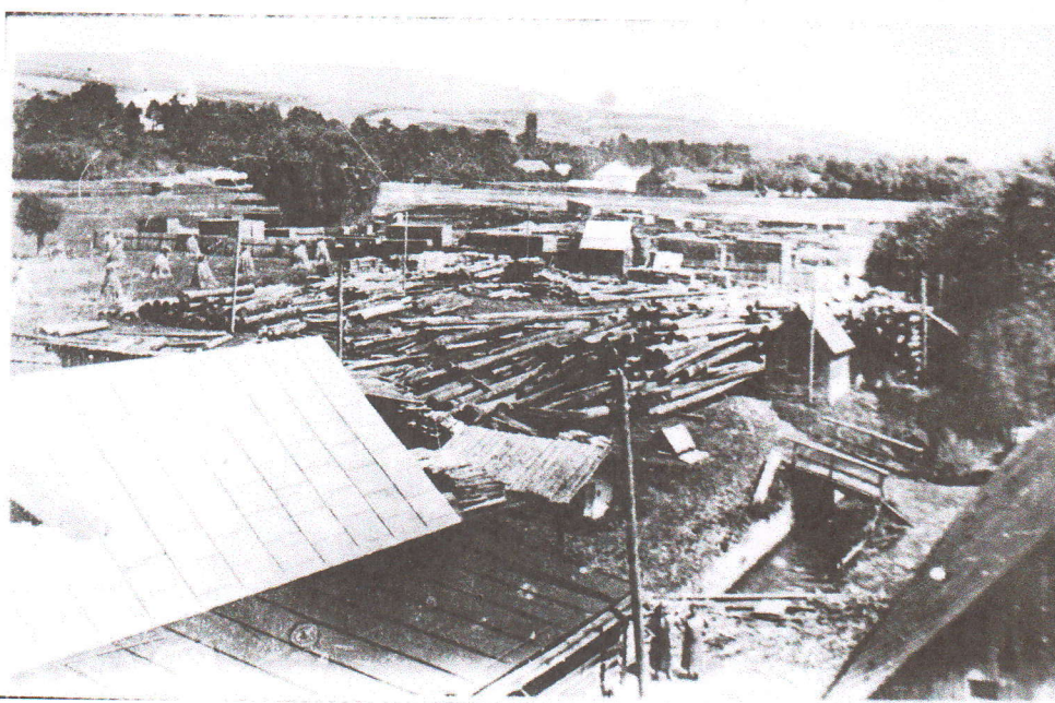
Valcový mlyn v Toryse v roku 1942