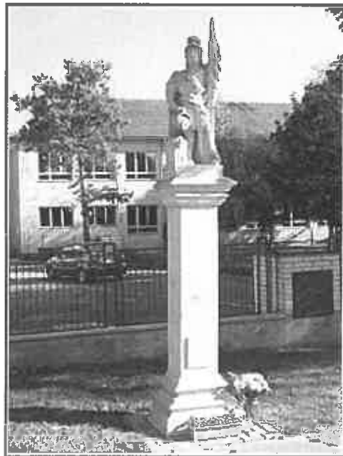
Pri budove ZŠ je umiestnená plastika sv. Floriána. v obci sa nachádza drobná sakrálna stavba - kaplnka sv. Jána Nepomuckého, ktorá bola v nedávnom období obnovená.