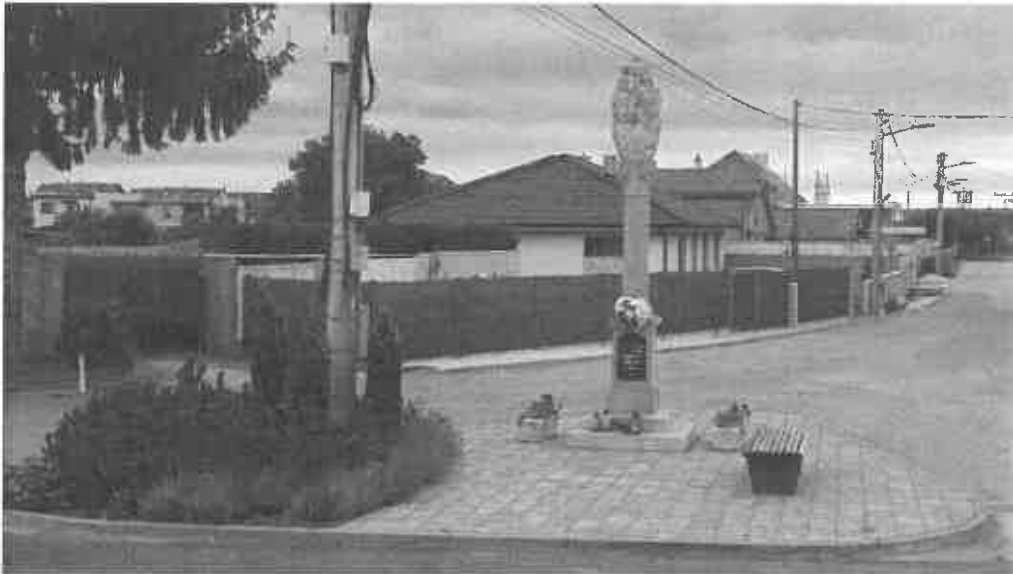
socha Najsvätejšej Trojice postavená v roku 1923 Ruženským spolkom .