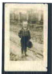
Autor: Ľ. Krošlák rok 1936