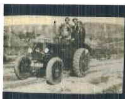
traktor Autor: Ľ. Krošlák