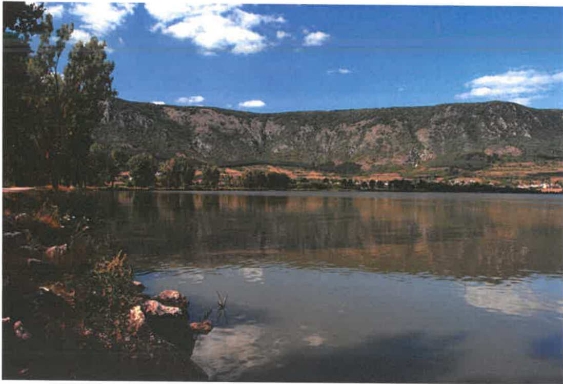
Hrhovské rybníky pohľad na Planinu Horný vrch

Z geomorfologického členenia patrí územie Hrhovských rybníkov do subprovincie Vnútorných Západných Karpát, oblasti Slovenského rudohoria, celku Slovenský kras a oddielu Turnianska kotlina.