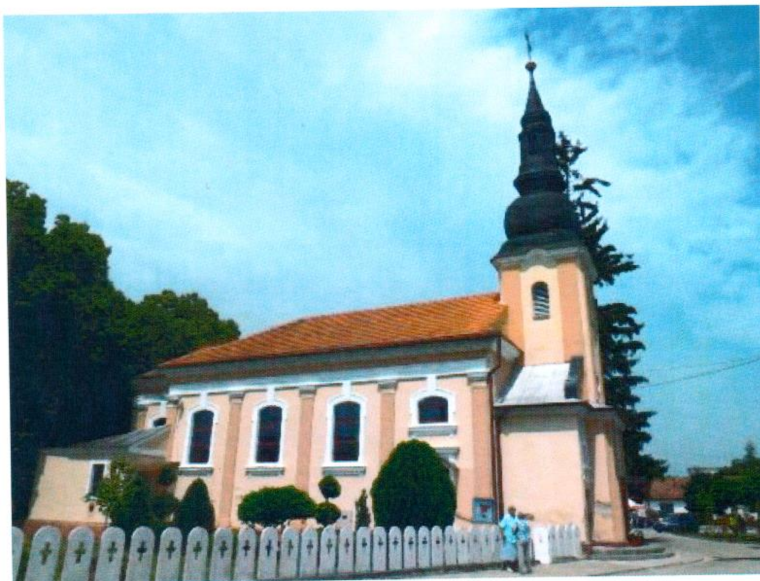
Kostol sv. Imricha