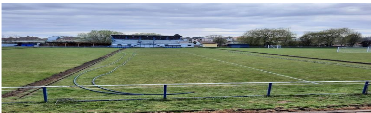
Realizácia zavlažovacieho systému