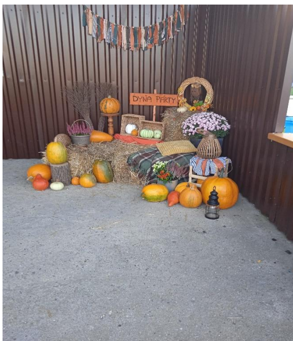
Jesenná akcia pre deti-Dyňapárty