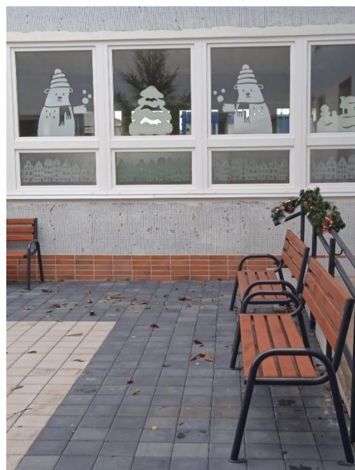
Oddychová časť na školskom dvore