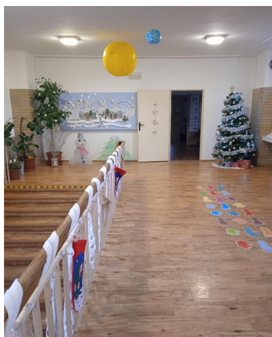
Priestory chodby v škole