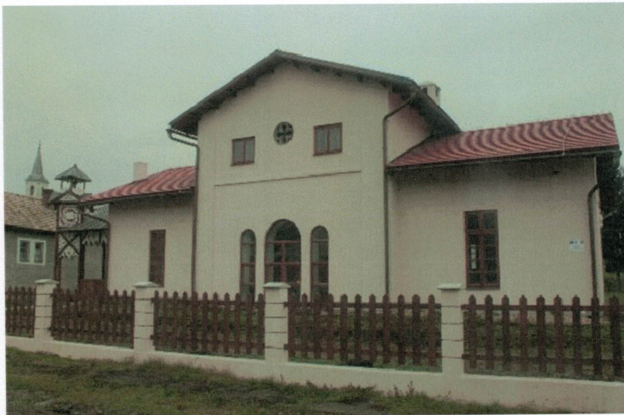
Múzeum regiónu Údolie Gortvy