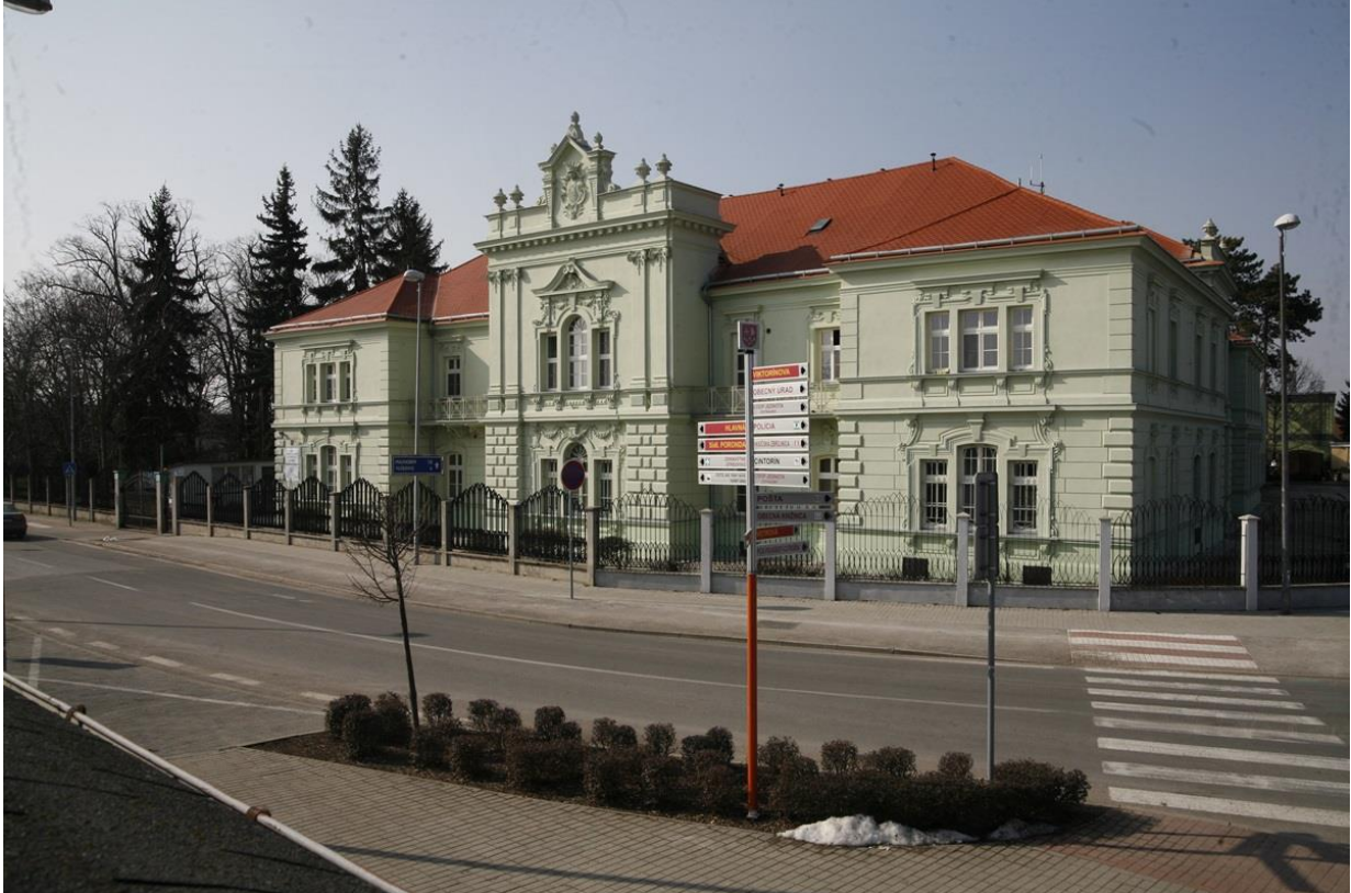
Kaštieľ rodiny Majláthovcov zo začiatku 19. storočia, dnes Domov sociálnych služieb pre dospelých v správe VÚC Trnava

Medzi kultúrne pamiatky patrí kaštieľ rodu Majláthovcov spolu s parkom.