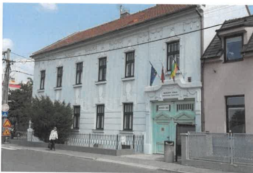
Obrázok č. 1 Miestny úrad mestskej časti Bratislava - Podunajské Biskupice na Trojičnom námestí 11.