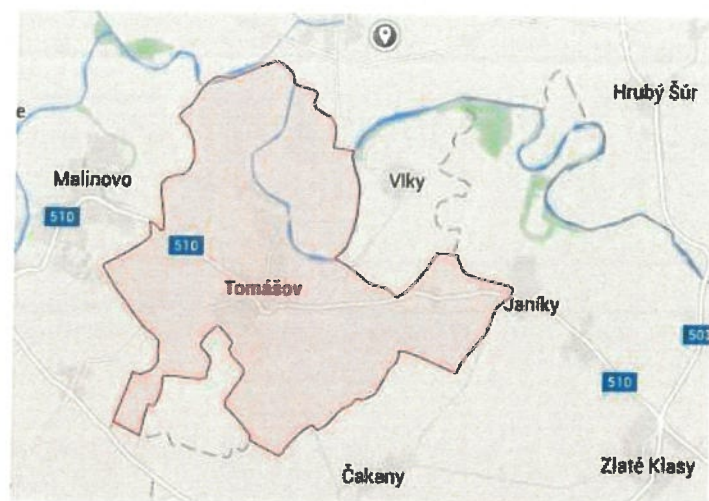
Obrázok 7 Geografická poloha obce Tomášov