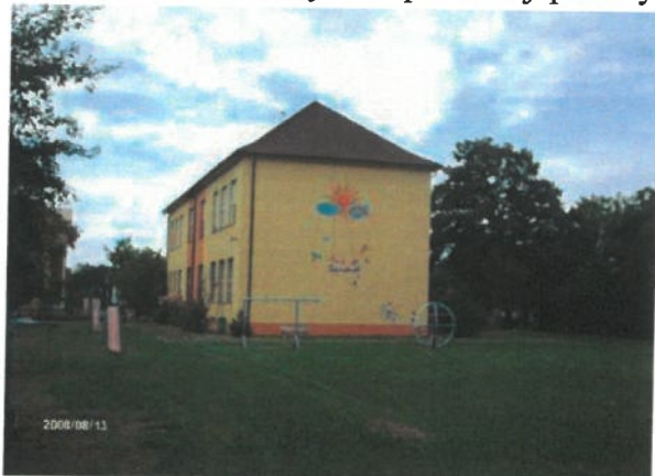
Obrázok 3 Budova pôvodnej ľudovej školy

Kaplnka sv. Kríža je neogotická stavba z konca 19. storočia. Okolo roku 1965 vyhorela a obnovili ju do pôvodnej podoby. Kaplnka v súčasnosti slúži ako dom smútku.