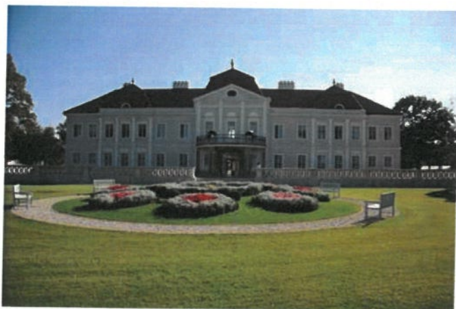
Obrázok 1 Barokový kaštieľ Majorháza

Za budovou barokového kaštieľa bol založený park na počesť kráľovnej Alžbety nazývaný ako Alžbetina záhrada. Ide o rozsiahly a pomerne dobre zachovaný anglický park.