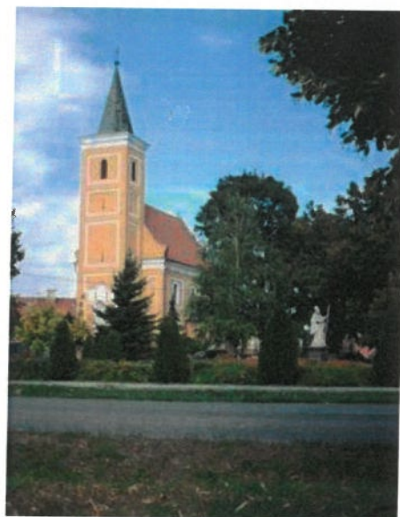
Obrázok 2 Kostol sv. Mikuláša