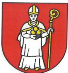
Obrázok 5 Erb obce Tomášov

Symbolmi obce sú erb, vlajka a pečat'. V červenom štíte je biskup - svätý Mikuláš - v striebornom zlatolemom rúchu, v pravici pred sebou s troma zlatými guľami na striebornej položenej knihe, v ľavici so zlatou berlou.