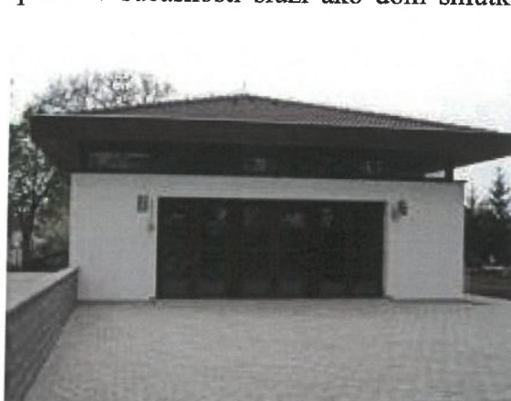
Obrázok 4 Kaplnka sv. Kríža

Pramene: http://www.pohrebnictvo.sk/dom-smutku-v-tomasove/