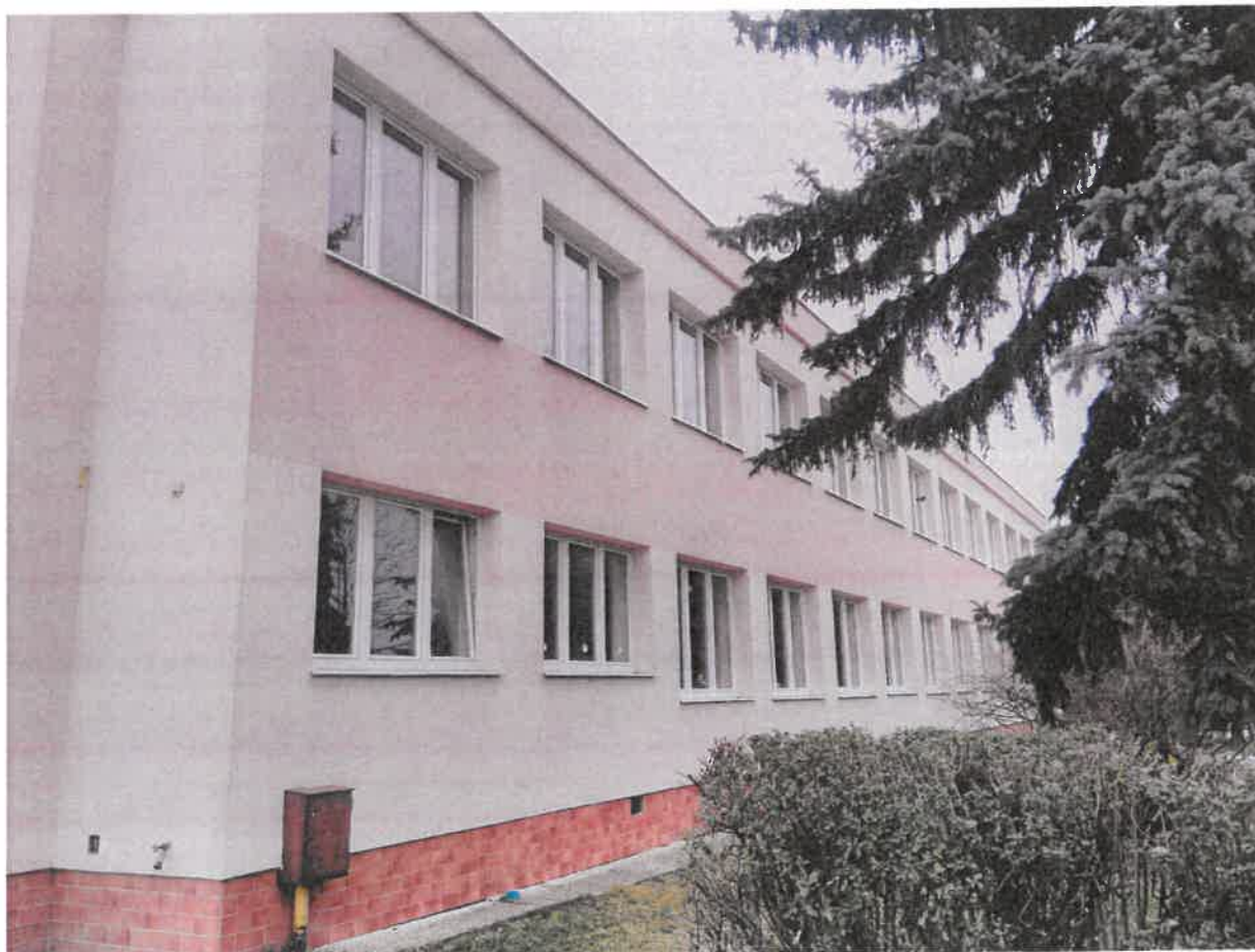
Základná škola – Alapiskola