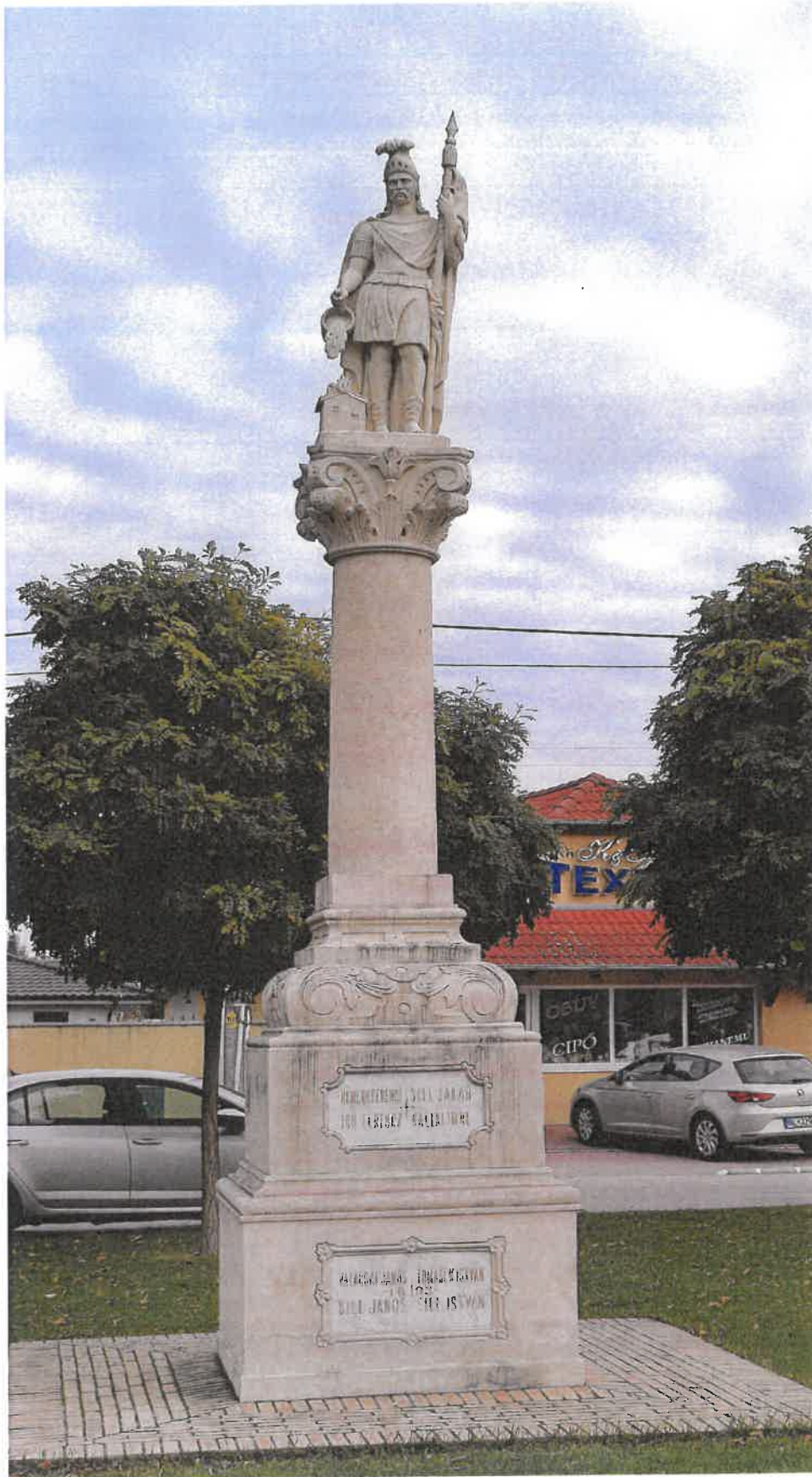
Socha Sv. Floriána