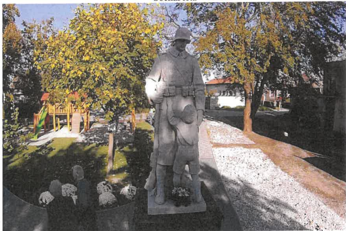
Socha – památník hrdinů I. sv. vojny