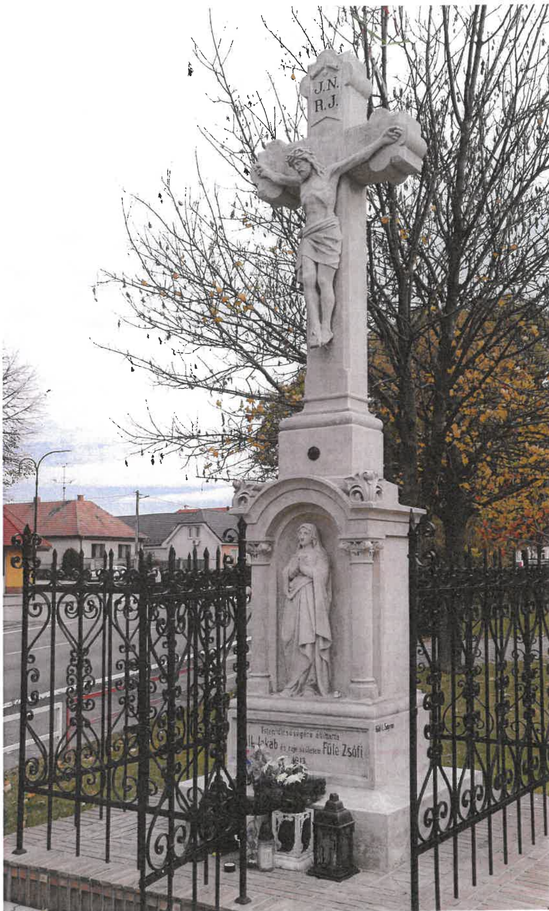
Socha Bieleho Kríža