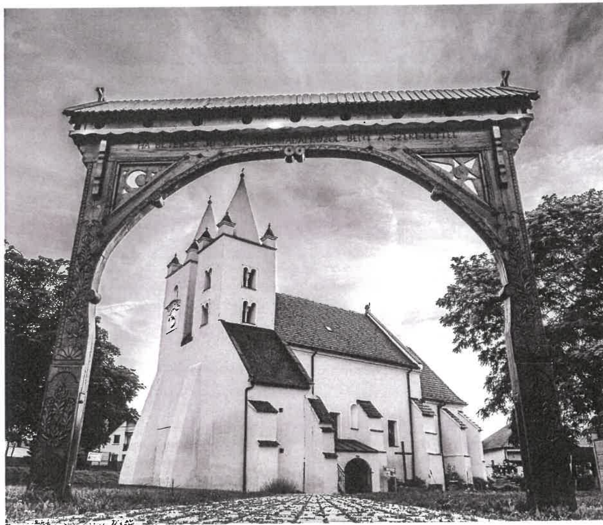
Rímsko - katolícky kostol Svätého.Jakuba – Národná kultúrna pamiatka