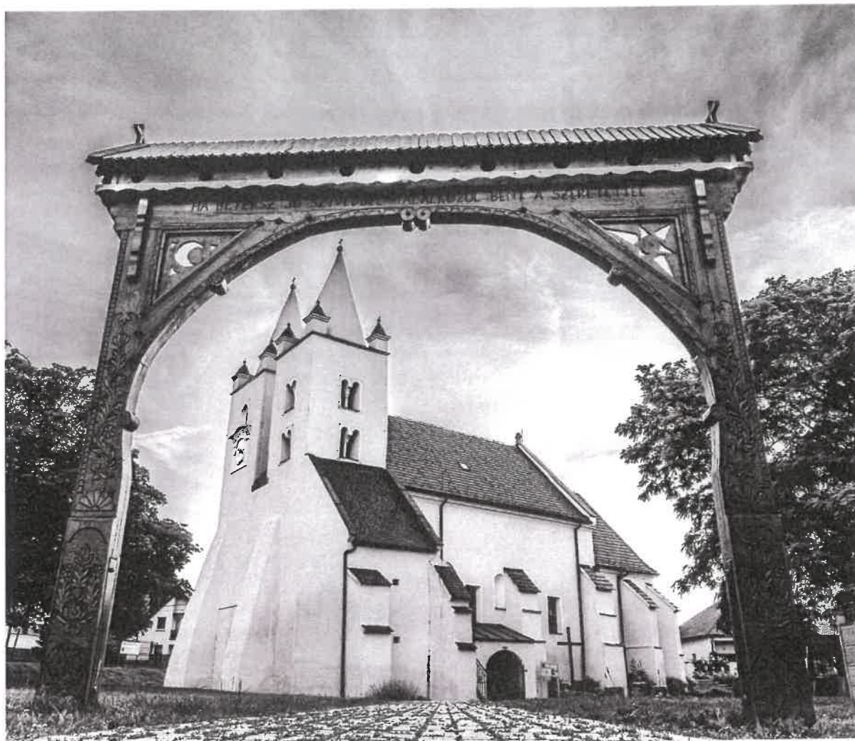
Rímsko - katolícky kostol Svätého Jakuba – Národná kultúrna pamiatka