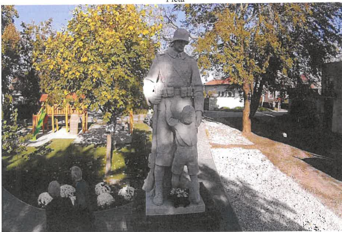
Socha – památník hrdinů I. sv. vojny