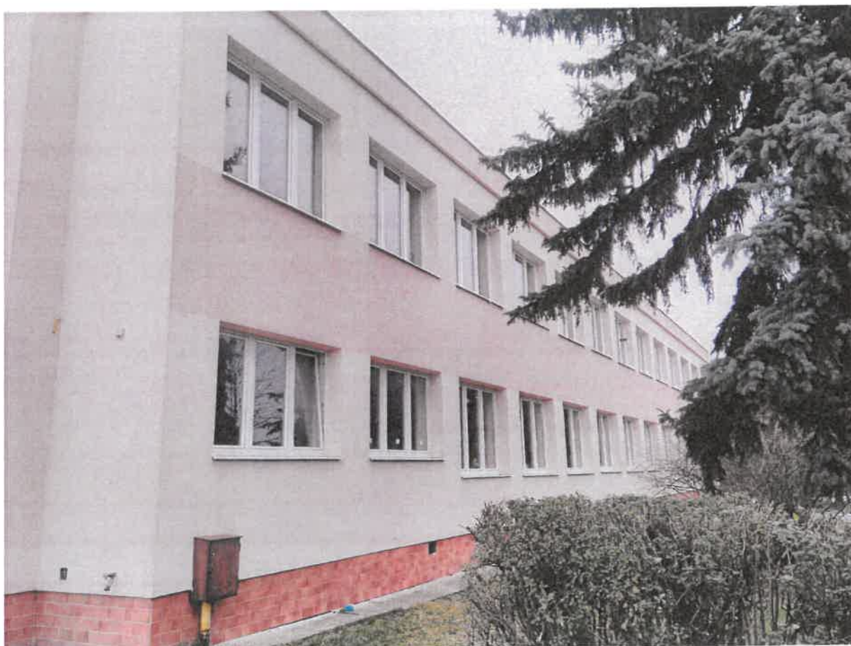
Základná škola – Alapiskola