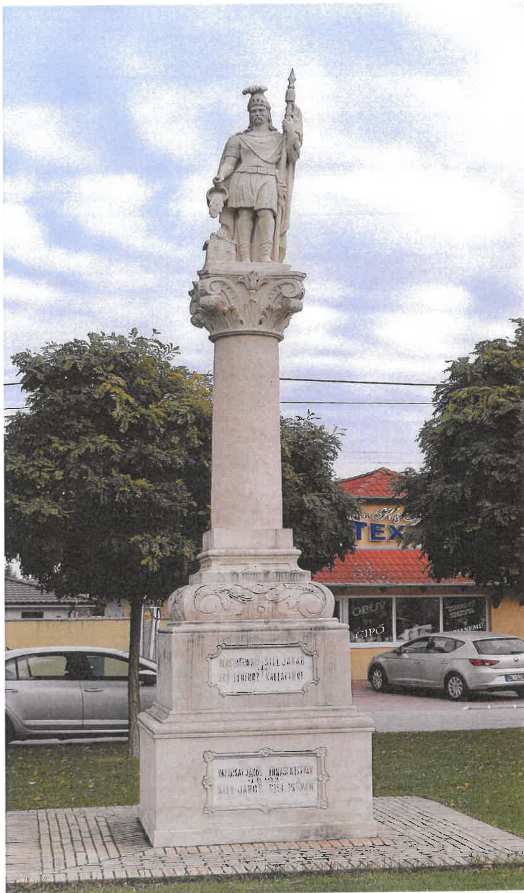
Socha Sv. Floriána