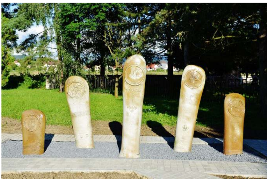
Monument piatich prstov

Monument piatich prstov – je symbolom piatich udalostí, ktoré prehrmeli Belušou: cholera, hlad, vojna, požiar, potopa.