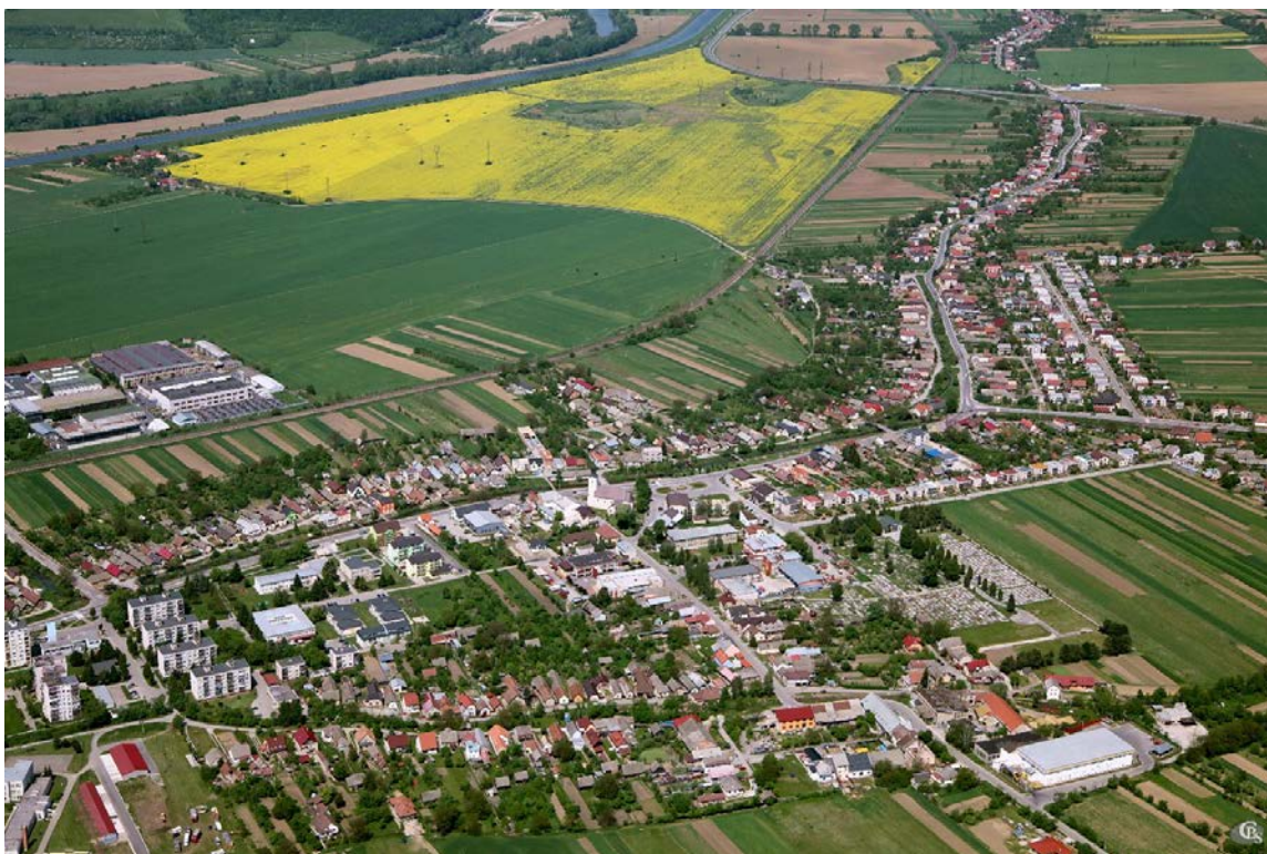
Pohľad na Belušu