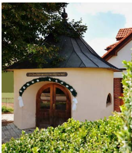
Kaplnka Svätého Jána Nepomuckého v Hloží