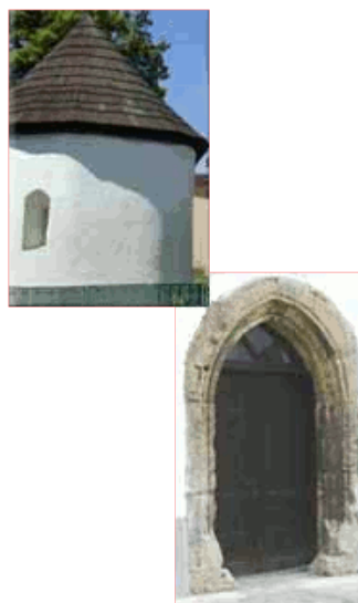
Kostolík sv. Anny s gotickým portálom priečelia