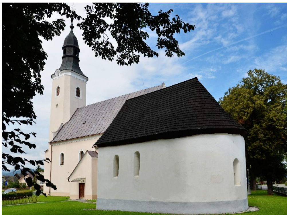
Farský kostol sv. Alžbety Uhorskej

Bol postavený v roku 1560 a zasvätený sv. Alžbete Uhorskej. Vybudovali ho z pieskovca. Tento prírodný kameň používali v tom čase v hojnej miere na stavbu monumentálnych objektov. Kostol postavený v renesančnom slohu, vznikol ako katolícky. Podľa kanonickej vizitácie z roku 1674, na hlavnom, ešte renesančnom oltári, stála socha Panny Márie na rukách s malým Ježiškom. Okolo nej boli sochy sv. Alžbety Uhorskej a sv. Márie Magdalény