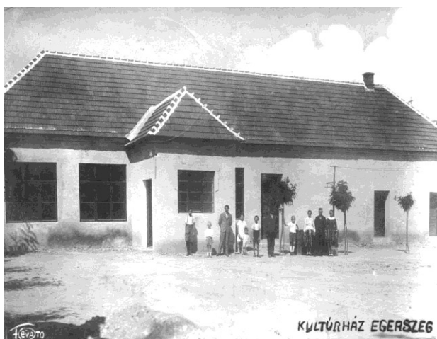
Kultúrny dom kedysi a dnes ...