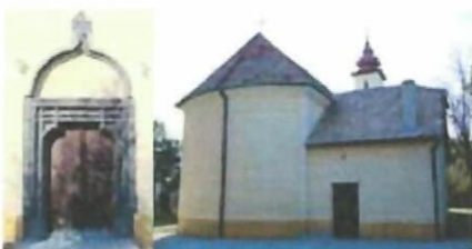
Kostol s runovým písmom

Presné datovanie kostola nepoznáme, je však pravdepodobné, že prvý tu stál už v 13 storočí. V 15 storočí sa budova dnešného kostola viackrát prestavala a "skoro úplne stratila pôvodný tvar". Kostol však zostal na pôvodnom mieste a v južnej časti steny starej lode i portál.