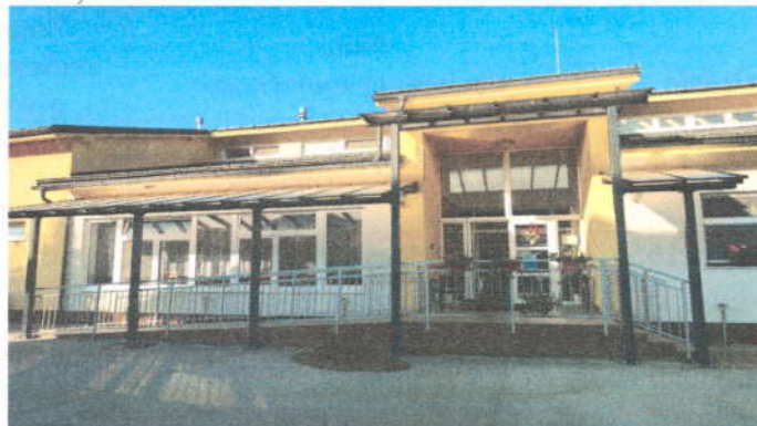
Konsolidovaná výročná správa obce Zborov nad Bystricou za rok 2023