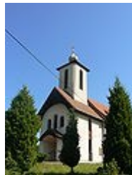
Chrám sv. Paraskevy