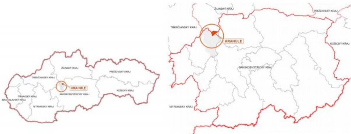
Obrázok: Poloha obce v rámci Slovenska a v rámci kraja

Horská obec Krahule leží na strednom Slovensku v centrálnej časti Kremnických vrchov. Je rozložená popri ceste od severozápadu smerom k juhovýchodu. Stred obce je vo výške 872 metrov nad morom, pričom najvyššia nadmorská výška je 1 060 m.n.m. Obec je 1 000 m dlhá a 150 m široká. Obec zaberá približne 15 ha a celková plocha chotára je 1076 ha. Chotár má tvar trojuholníka, kde kratšiu stranu tvorí línia od Trnovníka (989 m nad morom) po