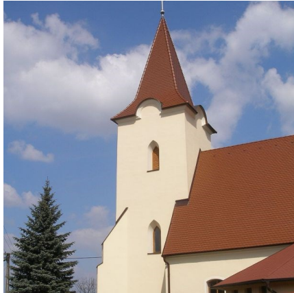
Rímskokatolícky kostol sv. Kataríny 1