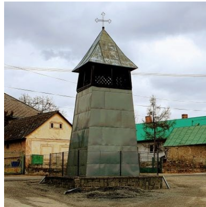
Evanjelická zvonica 1