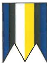
• Obecná vlajka