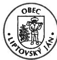
• Obecná pečať