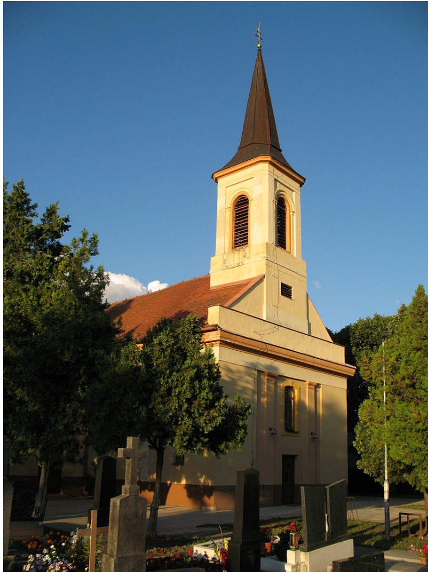
Obrázok č. 6: Kostol Svätej Alžbety