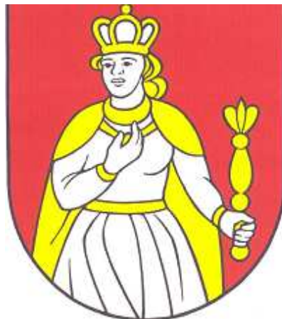
Obrázok č. 3: Erb obce Kráľová nad Váhom