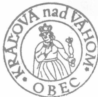
Obrázok č. 4: Pečiatka obce Kráľová nad Váhom