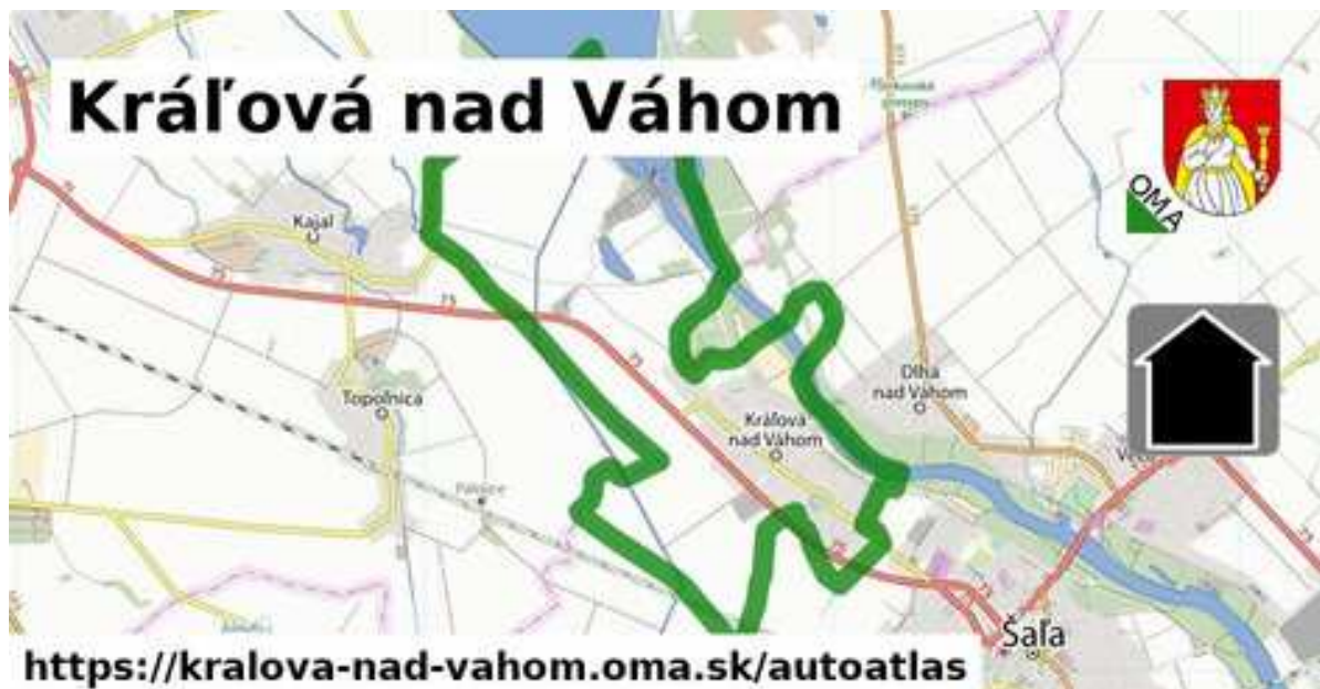
Obrázok č.1: Hranice katastrálneho územia obce susedia s katastrami obcí Diakovce, Topoľnica, Kajal, Váhovce, Šoporňa, Dlhá nad Váhom a mestom Šaľa

Podunajská nížina na ktorej sa obec rozprestiera patrí do teplej klimatickej oblasti s priemerom 50 letných dní ročne. Priemerná ročná teplota je 9,8 C , priemerný ročný úhrn zrážok je 550-600 mm a priemerná vlhkosť vzduchu je 80 %.