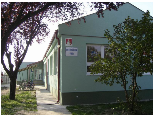
Obrázok č. 7: Materská škola