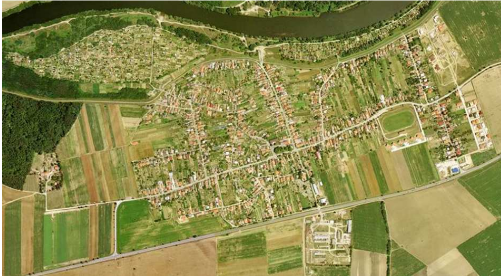
Obrázok č.2: Pohľad na obec Kráľová nad Váhom z výšky

V Obci Kráľová nad Váhom žije v k 31.12.2023 1 860 obyvateľov. Od roku 2001 do roku 2022 vývoj počtu obyvateľov obce zaznamenal stúpajúcu tendenciu. V Obci Kráľová nad Váhom pribúdajú nové stavebné pozemky vďaka ktorým sa obec rozrastá a jej počet obyvateľov je každým rokom o niečo vyšší.