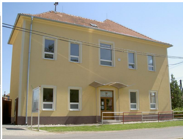
Obrázok č. 8: Základná škola