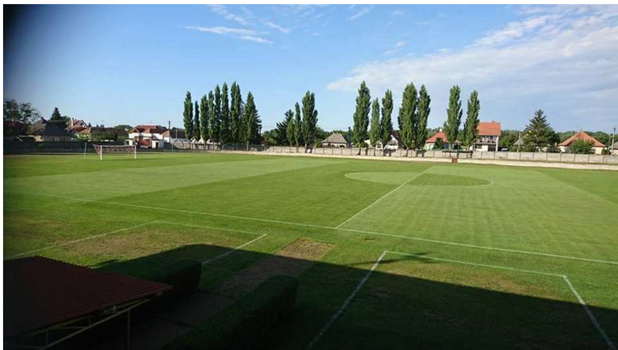
Obrázok č. 10: Futbalový štadión v obci Kráľová nad Váhom