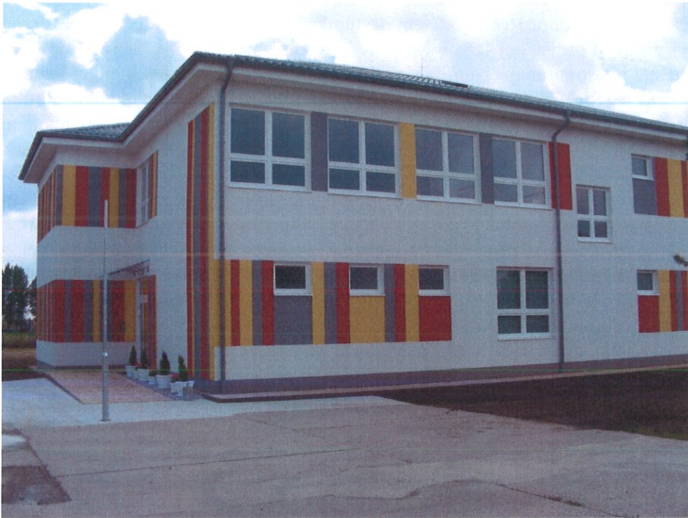
Materská škola, ul. 29. augusta 384, Most pri Bratislave