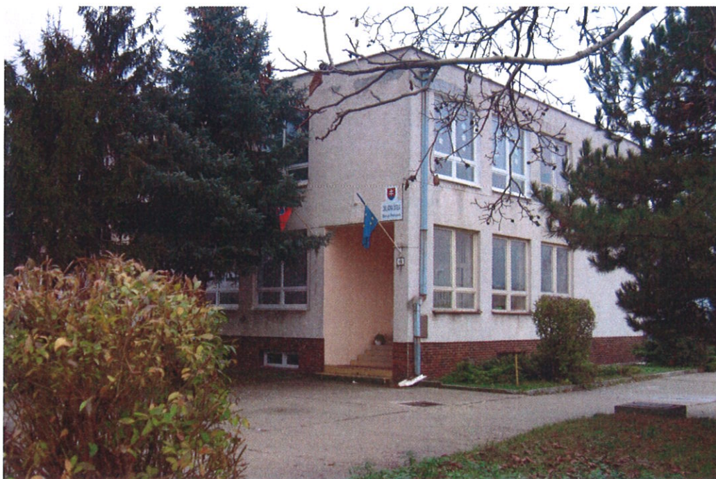
Základná škola , Športová 470, Most pri Bratislave , ktorá sídli v dvoch budovách

V súčasnosti výchovu a vzdelávanie detí v obci poskytuje: