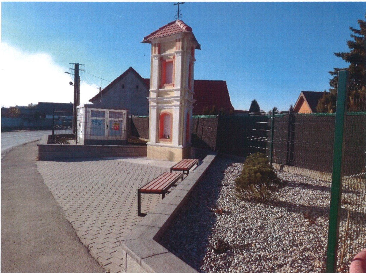
Postavená na prelome 18. a 19. storočia v klasicistickom slohu na pamiatku prekrstenia pôvodného