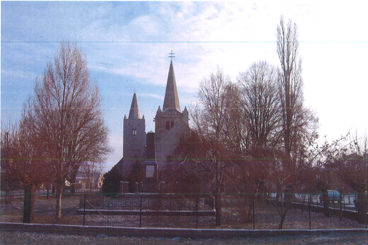
Božia muka pri dome č. 80–č.ÚZKP 10704/0 – vlastník Obecný úrad Most pri Bratislave