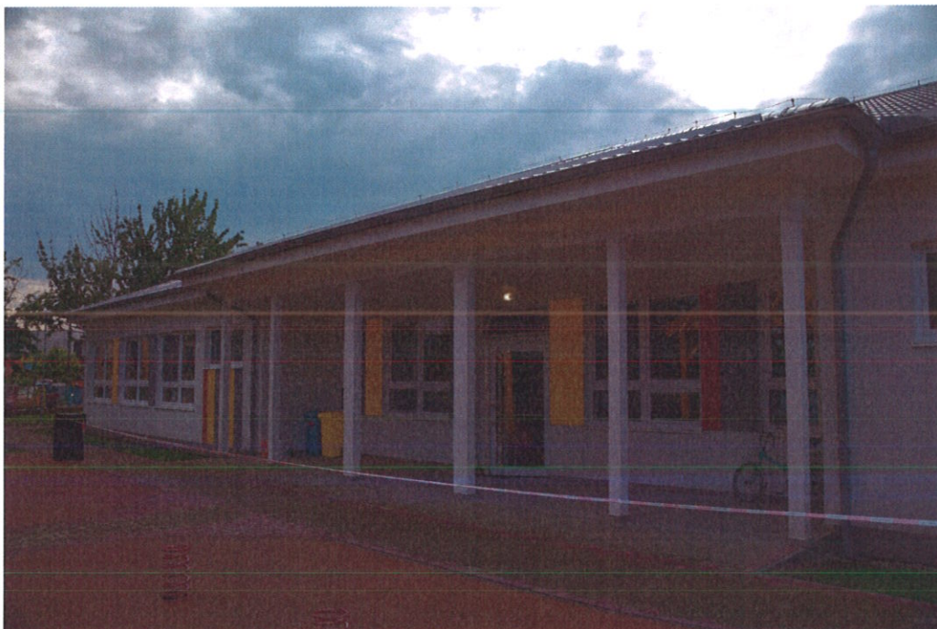
Materská škola, elokované pracovisko, Športová 1384, Most pri Bratislave

Obci Most pri Bratislave boli poskytnuté finančné prostriedky vo výške 200 000,- Eur z MV SR, určené na výstavbu novej telocvične pre základnú školu, ktorá od svojho vzniku nedisponovala telocvičňou. Stavba bola dokončená v decembri 2017, skvalitnil sa priestor pre rozvoj výchovy a vzdelávania žiakov v oblasti telesnej a športovej výchovy.