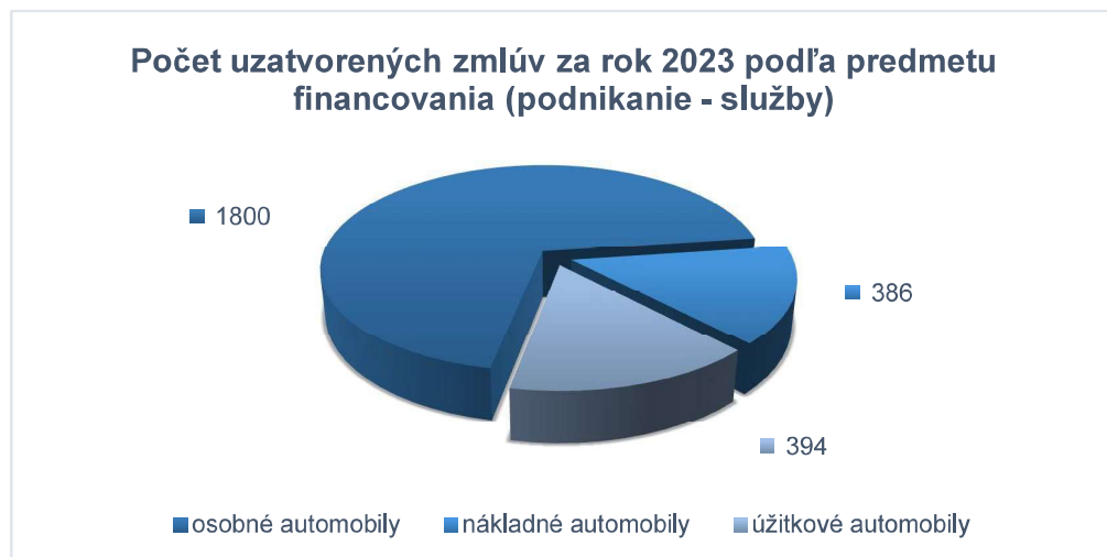
Graf 3: Počet uzatvorených zmlúv za rok 2023 v podnikateľskej sfére podľa typu predmetu financovania