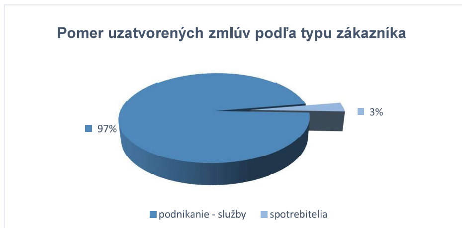
Graf 1: Pomer uzatvorených zmlúv v roku 2023 podľa typu zákazníka

V roku 2023 bolo 97 % zmlúv uzatvorených s podnikateľským sektorom v oblasti služieb. Najobľúbenejším spôsobom financovania v tejto skupine ostáva finančný leasing. Nezanedbateľnou skupinou v portfóliu zákazníkov sú spotrebitelia a ostatní zákazníci. Oproti roku 2022 nenastala v zákazníckom sektore žiadna výrazná zmena. Detailnejší záber na percentuálne zloženie uzatvorených zmlúv vzhľadom k typu financovania v podnikateľskom sektore sa nachádza na grafe č.2.