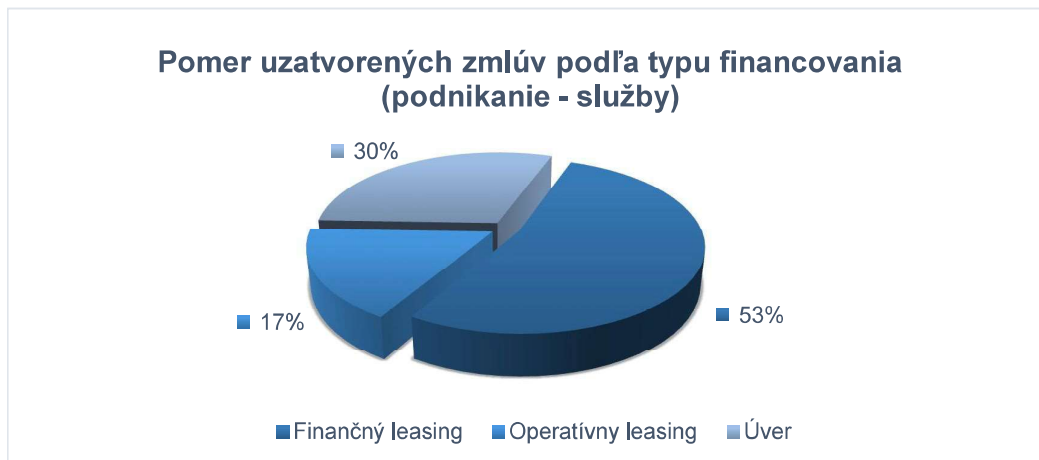
Graf 2: Typ financovania v podnikateľskom sektore v oblasti služieb

Podnikateľská sféra prejavila opäť najväčší záujem o osobné automobily.